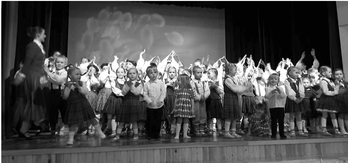
Uzstājas bērnu kolektīvs „Minkāns”