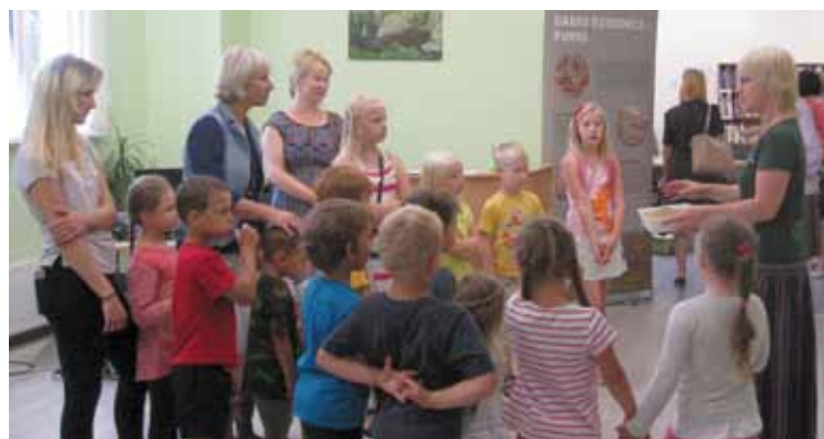
Dabas aizsardzības pārvaldes ceļojošā izstāde „Dabas dziednīca – purvs”.

Ceturtdien, 3. augustā, Vangažu pilsētas bibliotēkā tika atklāta Dabas aizsardzības pārvaldes ceļojošā izstāde „Dabas dziednīca – purvs”. Izstādes atklāšanā piedalījās PII „Jancis” bērni, kā arī citi interesenti.