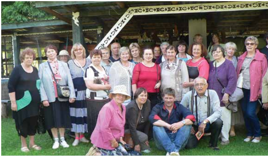
Vangažu, Inčukalna un Gaujas senioru šīsvasaras ekskursija uz Ainažiem un Pērnavu.