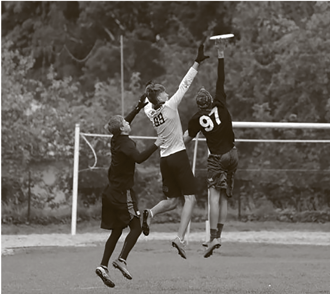
Inčukalna frisbija turnīrs – pirmo reizi novada vēsturē.

Inčukalna frisbija aktīvistu biedrība „Spirit of the Game” nesēnotikušo Inčukalna novada svētku ietvaros rīkoja Frisbija dienu. Ar Inčukalna novada pašvaldības konkursa „Novadnieki novadam” atbalstu kopā ar Inčukalna frisbija komandu „Wildcats” novada svētku apmeklētāji tika iepazīstināti ar daudzveidīgiem diska jeb lidojošā šķīvīša sporta veidiem.