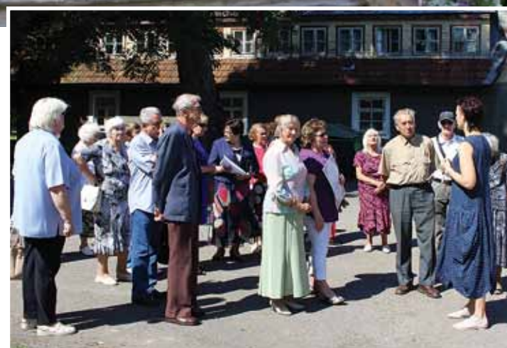
Šogad Goda novadniekiem tika organizēta ekskursija I gates pilī.

biedriski publiskās vietās: Inčukalna novada domē (Atmodas iela 4, Inčukalns), Vangažu pilsētas pārvaldē (Meža iela 1, Vangaži), Inčukalna tautas namā (Atmodas iela 1A, Inčukalns), Vangažu kultūras namā (Gaujas iela 12, Vangaži), Inčukalna bibliotēkā (Atmodas iela 4, Inčukalns), dienas centrā „Vangaži” (Parka iela 2, Vangaži), dienas centrā „Gauja” (Centra iela 6, Gauja). Aicinām sekot līdzi informācijai uz novada ziņojumu dēļiem, mājaslapā www.incukalns.lv , kā arī novada informatīvajā izdevumā „Novada Vēstis”.