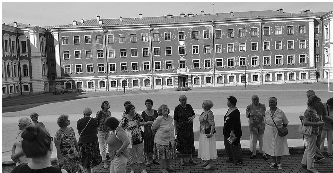
Inčukalna novada seniori Jelgavā aplūkoja pili, Lielupes promenādi un Jelgavas Svētās Trīsvienības baznīcu.

Šā gada augustā rosīgie un aktīvie Inčukalna novada seniori ar Inčukalna novada domes vadības un darbinieku atbalstu devās ikgadējā ekskursijā.