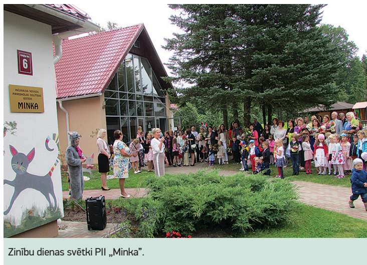
Zinību dienas svētki PII „Minka”.

pakaļ – uz paveikto bērnodārzā vasaras brīvlaika mēnešos. Jāteic, padarīta ir bijis gana daudz. Nevienam noteikti secen nepagāja jau jūnija pirmajās dienās aizsāktais ēkas siltināšanas process, ko brīžiem kavēja lietainie laikapstākļi. Šie būvniecības darbi lika sasparoties arī mums pašiem, lai izraktu, pārstrādātu un vienkārši attālākā teritorijās stūrītī saglabātu no dobēm izraktos ziemcietus, kuri pēc būvdarbu beigām jau ieņēmuši līdzšinējo vietu „Minkas” dobēs. Viegli jau nebija, bet kopā mums izdevās! Arī turpmāk mūsu skatus priecēs ziedu bagātība un krāšņums. Izmantot šo iespēju, vēlamies pateikt siltu paldies visiem darbiniekiem, kuri iesaistījās bērnodārza teritorijas sakopšanas darbos kā vasaras mēnešos, tā arī, tuvojoties jaunajam mācību cēlienam. Savukārt par puķu stādu dāvinājumu pateicamies SIA „Stādaudzētava Inčukalns” un