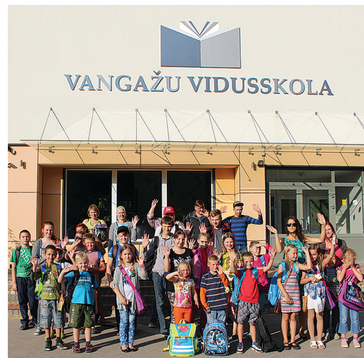
Šogad labdarības akcijas „Skolas soma 2017” ietvaros jaunas somas un treniņtērpus ieguva 38 Inčukalna novada bērni.