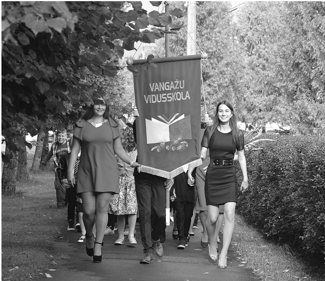
1. septembris Vangažu vidusskolas saimes 428 skolēniem un 45 pirmsskolas audzēkņiem iezīmē starta līniju 58. darba gada sākumam.

Jaunajai 10. klasei 20 skolēnu sastāvā tiks noteikti konkrēti mērķi, kas sasniedzami trijos mācību ga-