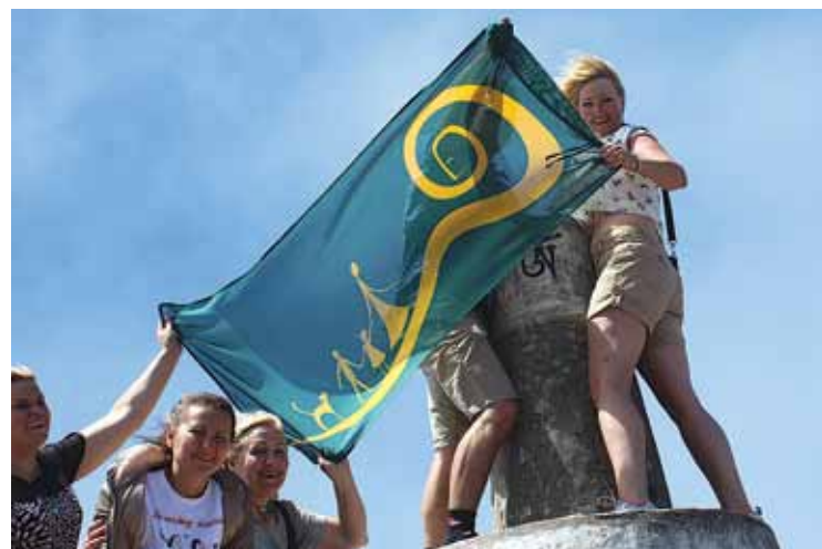
Foto uzņemts Zaļās nodarbības laikā vienā no vietējām augstākajām virsotnēm Monge, kas atrodas 500 metrus virs un 5000 metrus no Atlantijas okeāna. Vēja ātrums – aptuveni 25 metri sekundē.