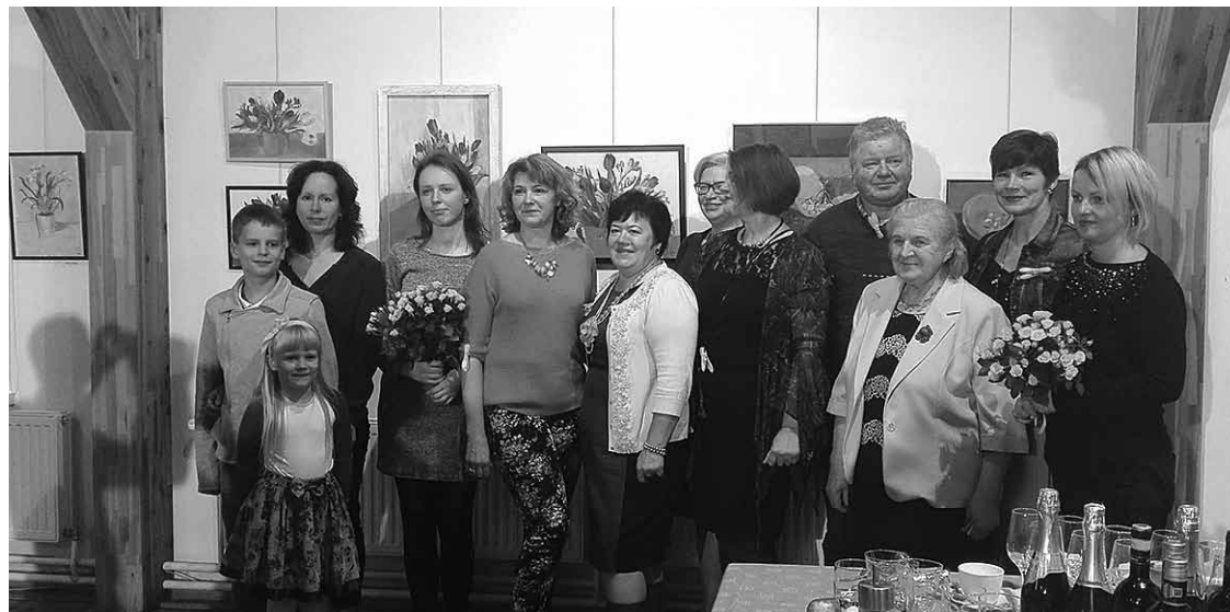
Daces Saulītes glezniecības studijas dalībnieki vienkopus.