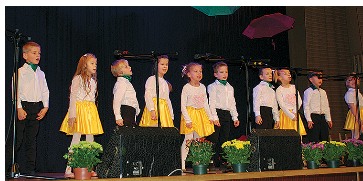
Inčukalna pamatskolas pirmsskolas sagatavošanas grupa „Sprīdīši”.