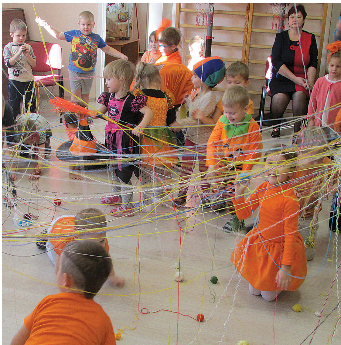
Bērnu un skolotāju tērpos un zāles noformējumā dominēja ķirbim tik raksturīgā oranžā krāsa, bet caur dziesmām un rotaļām tika godināts un iepazīts ķirbis.