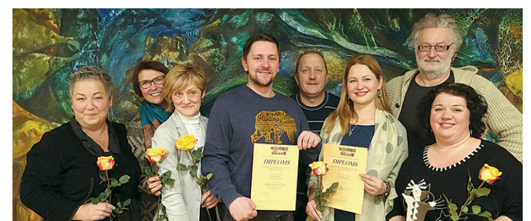
Inčukalna amatiereteātris saņēma balvu „Labākais aktieru kolektīvs 2017”.

Tautas nams jau gandrīz 10 gadu aicina inčukalniešus pirms gadumijas plkst. 00.00 iziet no savām mājām un pie lielās egles kopā ar citiem novadniekiem sagaidīt jauno gadu. Tā arī 2018. gadu sagaidījām pat ar jaunu vietēja mēroga naudu – „inčiem”, kurus, atminot asprātīgās mīklas, varēja saņemt tieši no „bankomāta”, uzreiz liekot lietā un azartiskā izsolē iegādājoties vērtīgas lietas. Bet liksmot gribētāji varēja doties uz tautas namu un līdz pat rītam dejot jautros 70. un 80. gadu ritmos. Simā lielā auguma „Jaunā gada” secinājums: Inčukalnā 2018. gadā viss būs labi – valdīs satiecība, draudzība un pārticība. Lai top! Ja kādam pietrūkst gaismas un ļoti gribas satikt Sauli, nāciet uz tautas namu un baudiet to.