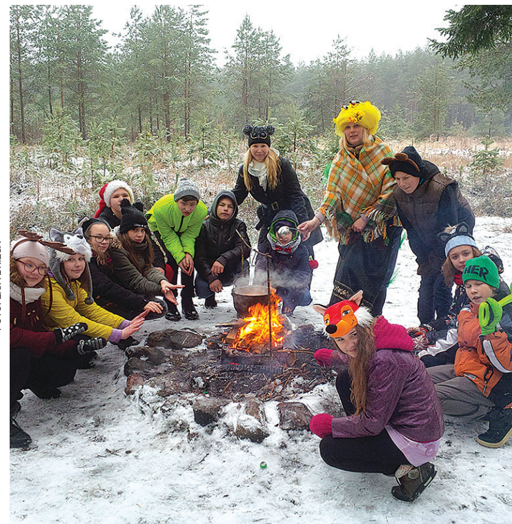
6.a klase ziemas piknikā „Cimos pie Meža mātes...”.

zupu, kas vārīta uz ugunsкура, un uzņēmām videoklipu/reklāmas rullīti, kas ir šī projekta gala rezultāts. Darba procesā bija jūtama daudzveidīga emociju buķete – prieks, zinātkāre, pārsteigums, drosme, stress, bailes, asaras no smiekliem, atbildības izjūta utt. Skolēni secināja, cik grūts un tomēr atbildīgs ir aktieru darbs (pārgērbties vairākas reizes, ar žestiem un mīmiku spēlēt parādīt dažādas emocijas, atcerēties tekstu, kustēties, sameklēt atbilstošu mūziku). Filmēšanās mežā notika četras piecas stundas, un skolēni brīnījās, ka video tapa 4 minūšu garš, ko citām partnerskolām parādīt. Secinām, ka radošums un inovācija ir neatņemama daudzu zināšanu un prasmju sastāvdaļa. Radošums ir ļoti piepildošs. Mūsdienās radošums darba procesā tiek uzskatīts par vissvarīgāko kvalitāti, lai sastaptos ar aizvien sarežģītākiem un nenoteiktākiem pasaules izaicinājumiem.