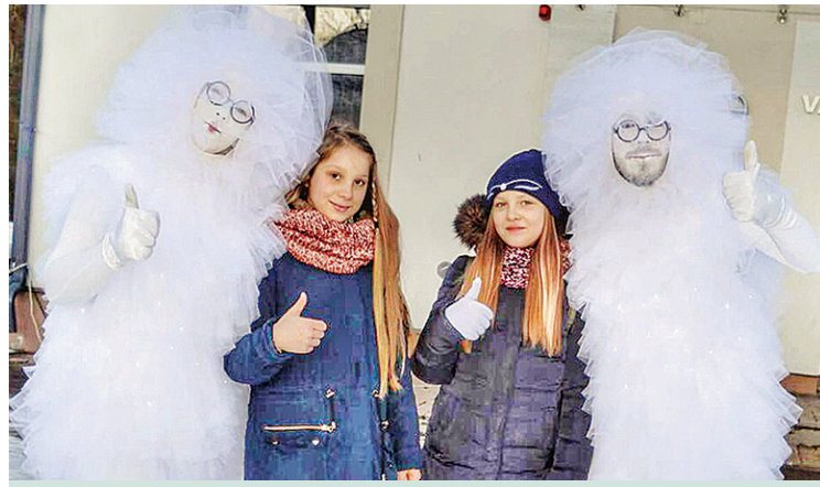
Vangažos viesojās „Kašera Sapņu fabrikas” Sniegpārslīņas.

7. janvārī pie kultūras nama aizvadījām Zvaigznes dienu, ar kuru saistās daudzi un dažādi ticējumi un seni svētki, kas apliecina saules atgriešanos.