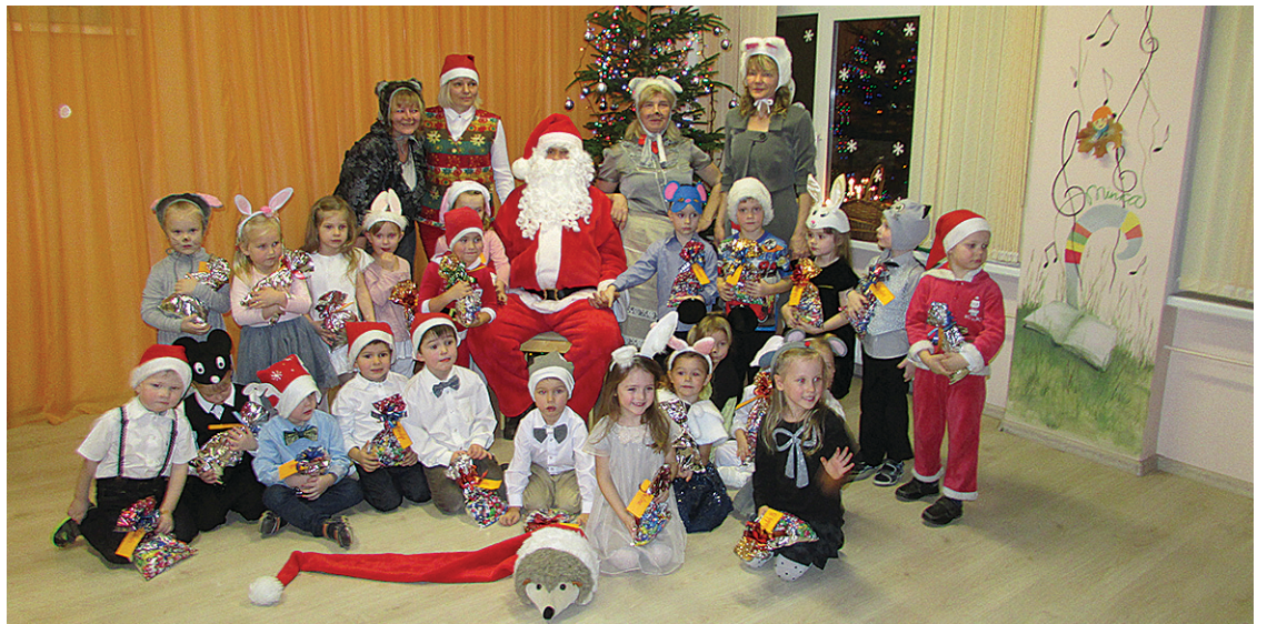
PII „Minka” kolektīvs visiem jaunajā gadā vēl labu veselību, laimi, mīlestību un pārticību ģimenē!

Jau izskanējušas Ziemassvētku dziesmas, nedaudz gaisos izplēnējusi piparkūku smarža, bet paši, krāšņu salūtu pavadīti, esam iesoļojuši jaunā gadā. Kā pagājušo svētku liecinieki šur tur eglīšu zaros vēji vēl iešūpo krāsaino lampiņu ugunis, un izrotātajos logos joprojām sniegbalti staro sniegpārslīņas. Šķiet mazliet skumji, ka ilgi gaidītie un lolotie svētki tik ātri aizvadīti. Tāpēc, lūkojoties vēl gaišajās svecīšu liesmiņās, atgriezāties noutikums, kas ikvienam no mums – lielam vai mazam – bijuši svarīgi un nozīmīgi.