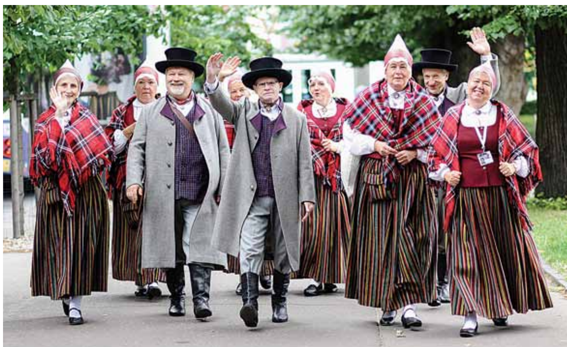
Kas tur soļo, kas tur iet? Tie ir Inčukalna senioru deju kolektīvs „Virši” ceļā uz Dziesmusvētku gājiena startu.