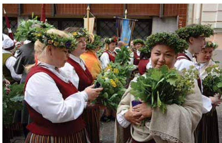
Inčukalna tautas nama jauktā kora „Mežābele” sievas mētru vainadziņos.