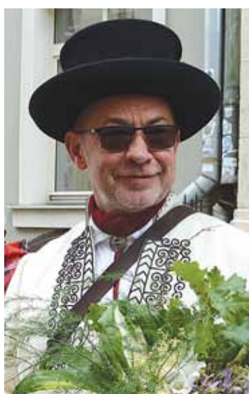
Inčukalna tautas nama vidējās paaudzes deju kolektīva „Virši” vadītājs.