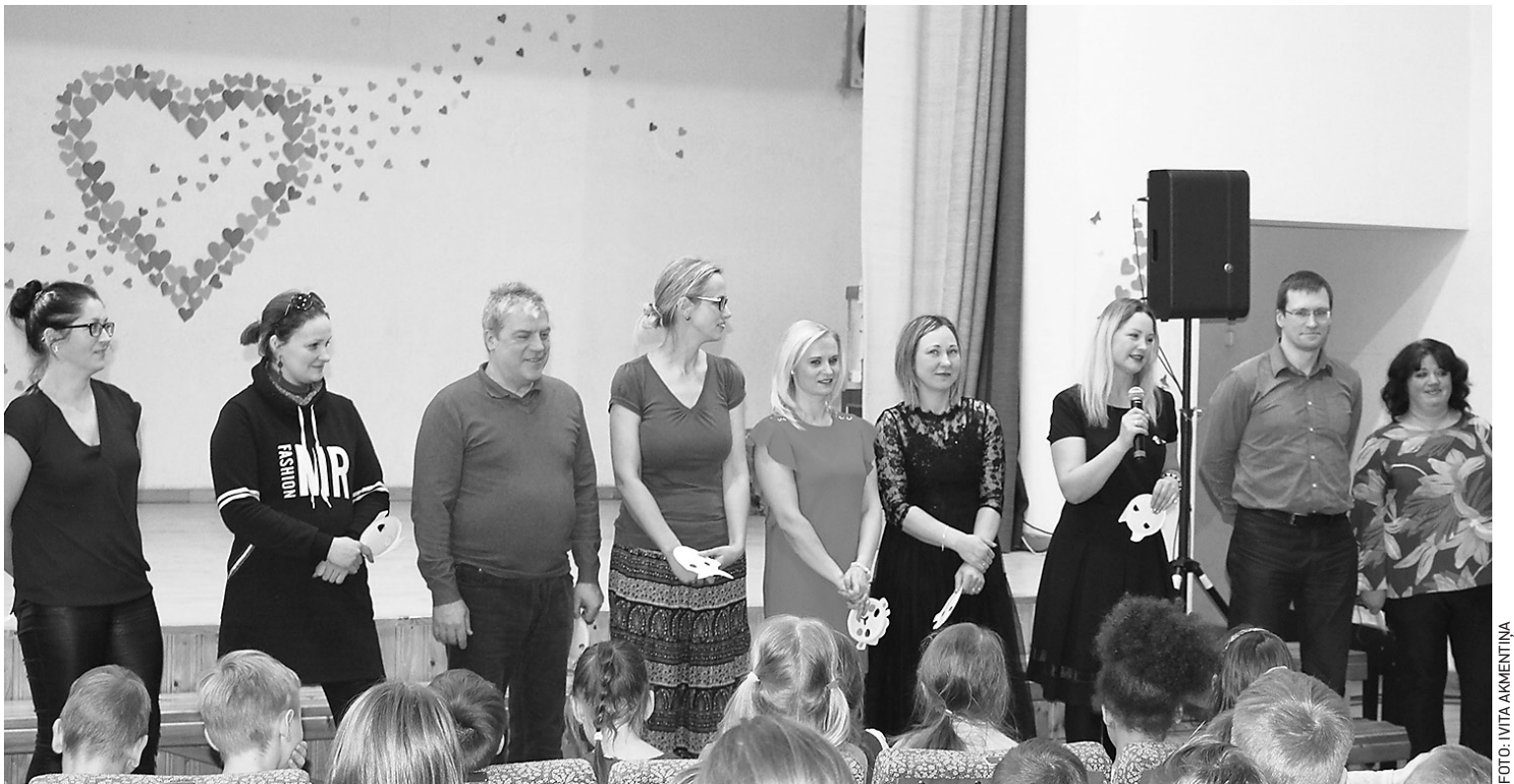
Tūlīt vecāki dziedās dziesmu „Mūsu pļavā, zaļā pļavā”.

Mūsu pedagogi jau no septembra ir sākuši gatavoties pārmaiņām skolā, kas sagaidāmas, sākot ar 2020./2021. mācību gadu. Visvairāk ir nepieciešamas zināšanas un pieredze, tā esam nolēmuši. Tieši tāpēc katru otrdienu sanākam kopā darba grupās, lai kopīgi plānotu, mācītos un dalītos pieredzē. No janvāra sākuma apmeklējam stundas cits pie cita, lai pēc tam kopā tās analizētu, pārņemtu pieredzi, mācītos izvirzīt stundā sasniedzamo rezultātu, palīdzētu risināt radušās grūtības, paskatītos, kā stundās tiek izmantotas jaunas mācību metodes. Šobrīd, raksta tapšanas laikā, ir bijušas 19 atklātās stundas gandrīz visos mācību priekšmetos, bet līdz mācību gada beigām katrs pedagogs ir apņēmis novadīt trīs atklātās stundas. Skolā esam 30 skolotāji, tātad līdz maija beigām būs bijusi iespēja vērot aptuveni 90 stundas. Tas ir ne vien interesanti, bet arī ļoti izglītojoši. Katru atklāto stundu apmeklē 2–5 kolēģi, bet, stundai beidzoties, katram ir jāizmanto princips „3 P”: paslavē, pajautā, piedāvā. Mēs cits pie cita ejam mācīties un cits citu atbalstīt.