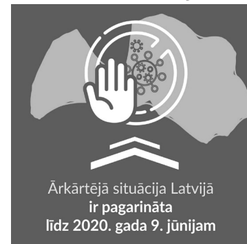
Ārkārtējā situācija Latvijā ir pagarināta līdz 2020. gada 9. jūnijam

jās izglītības iestādēs lēmumu pieņem aizsardzības ministrs, savukārt iekšlietu sistēmas izglītības iestādēs to pieņem iekšlietu ministrs. Klātienē drīkst notikt arī organizēti bezkontakta sporta treniņi vai nodarbinātība, ievērojot šādus nosacījumus: