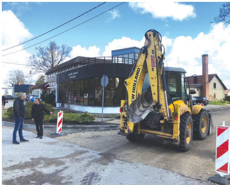
Noris remontdarbi Cīruļu ielā, Inčukalnā.

Iedzīvotājiem būtu svarīgi uzzināt arī par plānotajiem darbiem, kas saistīti ar ceļu sakārtošanu novada teritorijā. Pašvaldība ir noslēgusi līgumu par apliecinājuma karšu izgatavošanu asfalta seguma virskārtas atjaunošanai Plānupes ielas, Miera ielas, Nākotnes ielas posmos Inčukalnā, neliela posma asfalta seguma virskārtas atjaunošanai Gaujasliču ielā Gaujas cie-