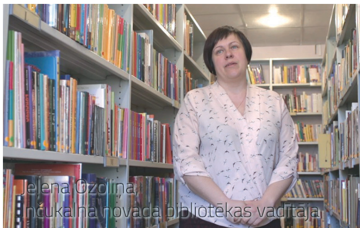
Kadrs no pirmā videostāsta projektā „Inčukalna novada tuvplāni”.

matā. Bruģa segumu atjaunošana un paplašināšana no 1 līdz 1,5 metriem paredzēta arī Inčukalnā, Atmodas ielā posmā līdz Zvaigžņu ielai. Savukārt Vangažos paredzēta bruģa seguma atjaunošana Siguldas ielas gājēju ietvei. Šogad esam iecerējuši atjaunot ceļa segumu un uzstādīt drošas margas gājēju tiltiņam Vangažos, kurš atrodas netālu no „Vangažu namsaimnieka” ēkas.