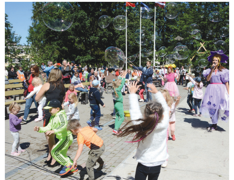
Inčukalna novada svētki kustībā 2019. gada vasarā, šogad līdz svētkiem vēl jāpaciesas.

Izmantojot izdevību, vēlos aicināt iedzīvotājus sakārtot savu apkārtni