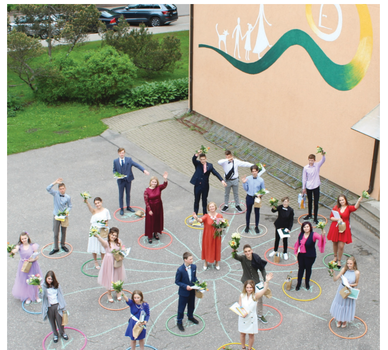
Inčukalna pamatskolas 9. klases skolēniem apliecības par pamatizglītības iegūšanu pasniegtas 2020. gada 12. jūnijā.