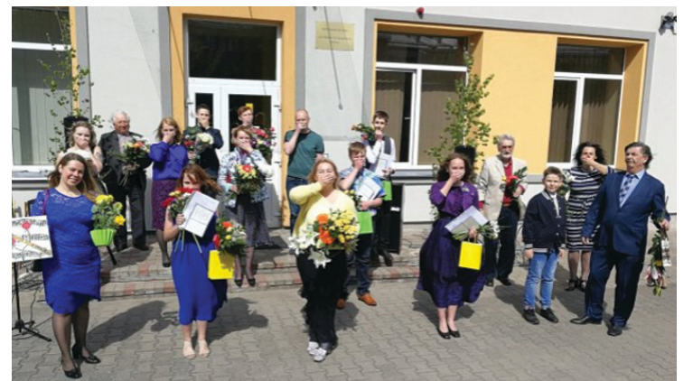
Inčukalna novada Mūzikas un mākslas skolas absolventi 2020. gada 29. maijā.

Inčukalna novada pašvaldības Sabiedrisko attiecību daļa