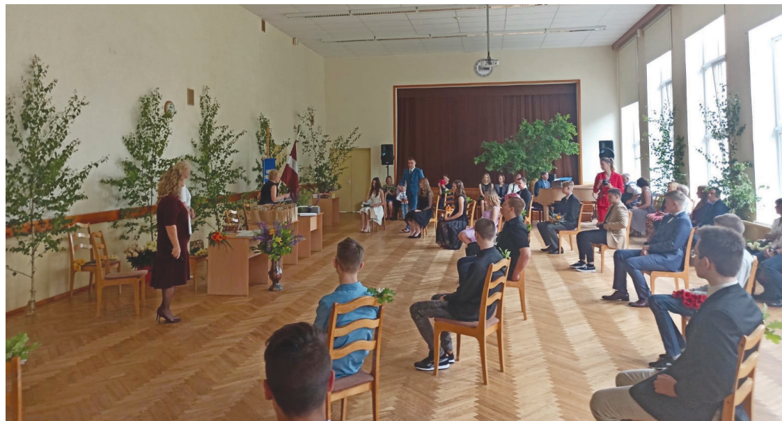
Vangažu vidusskolas 9. klašu izlaidumi notika 2020. gada 12. jūnijā.