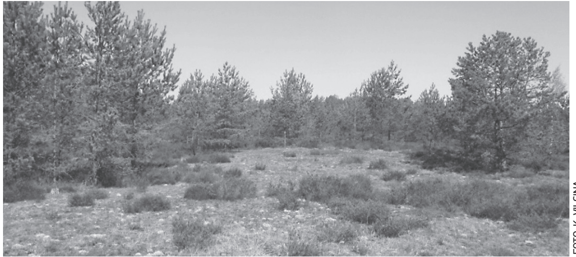
Virsjā dabas liegumā „Garkalnes meži”.

Plāna izstrāde notiek Dabas aizsardzības pārvaldes īstenotās dabas skaitīšanas jeb Eiropas Savienības Kohēzijas fonda projekta „Priekšnosacījumu izveide labākai bioloģiskās daudzveidības saglabāšanai un ekosistēmu aizsardzībai Latvijā” (Nr. 5.4.2.1/16/l/001) ietvaros.