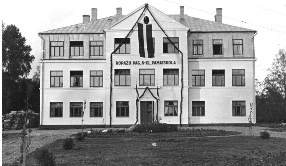
Ropažu skola 1936.gada septembrī

Interesanti materiāli un fotoattēli ataino Ropažu vidusskolas, tolaik 6.klašu pamatskolas ēkas būvniecību. Kāds dokuments stāsta: „1936.gada 27.septembrī iesvētīja jauncelto 6-kl.pamatskolas ēku, kurai pamatakmeni lika 1934.gada 3.jūnijā. Jaunceltne izmaksāja, neieskaitot