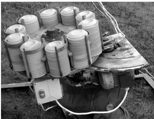
Šādas ierīces izšauj gaisā mērķus – „māla baložus”