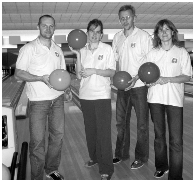
Ropažu novada veiksmīgie boulinga spēlētāji