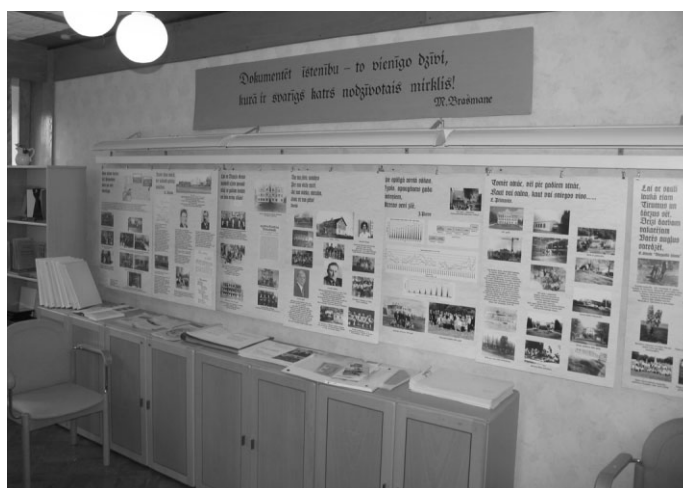
Daļa no skolas muzeja ekspozīcijas