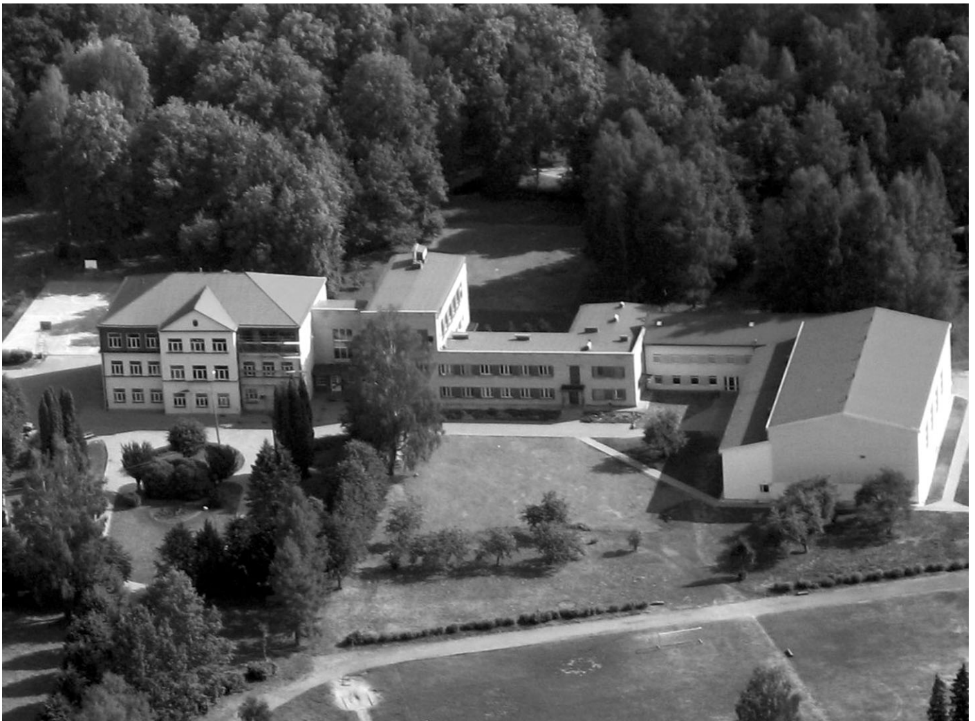
Ropažu vidusskola šī gada vasarā

Ar neapbruņotām acīm debesīs tu redzēsi sauli un zvaigznes vien, ar tālskati - daudz vairāk. Debesis slēpj bezgalību, kuru tu citādi nespēj saskatīt. tieši tā - kā debesis - iedomājies cilvēku! Neļauj, lai mākoņi tevi maldina! Tālskatis uz šīm debesīm ir tevis paša labvēlība un mīlestība.