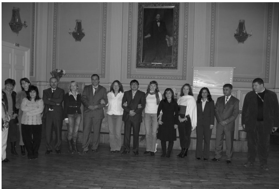
Bulgārijas, Turcijas un Latvijas skolotāji, projekta dalībnieki pēc pirmās darba sesijas

aprīlī tikšanās notiks Turcijā, uz to dosies arī bērni, 2008.gadā ciemiņus uzņemsim mēs, bet 2009.gadā būs noslēguma tikšanās.