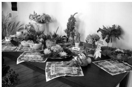
Interesantie eksponāti no pašu izaudzētās ražas

Oktobrī novada autobuss pensionārus aizvīzina uz Mālpili, kur noskatījāmies Dailes teātra izrādi "Izvirtulis." Novembrī