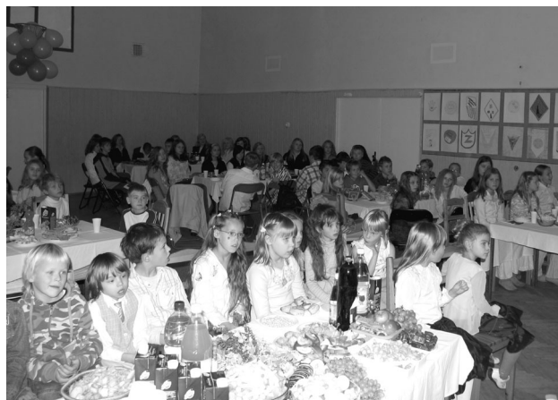
Skolēni kopā ar skolotājiem jubilejas svinībās

Strādājot pie projektiem, skolēniem bija jāpielieto dažādas iepriekš iegūtās prasmes un iemaņas – jāveido jautājumi intervijai, jāizveido aptaujas anketas un jāapkopo iegūtie rezultāti, jāfotografē ar digitālo fotoaparātu, jāizraugās veiksmīgākais kadrs rakursā, jāapstrādā digitālie attēli datorā, jāveido prezentācijas dizains, kā arī jāprot