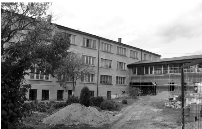
SAC „Ropaži” noris vērienīgi celtniecības darbi

Alternatīvās aprūpes struktūras „Pusceļa