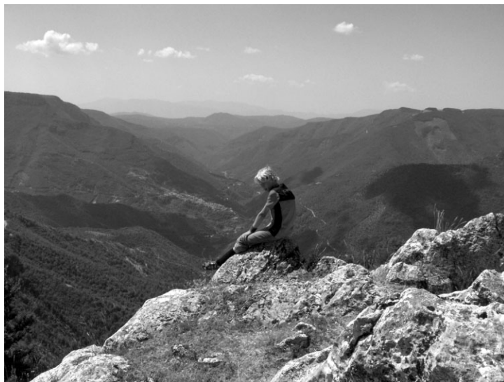
Lieliskā sajūta kalnos, kad pasaule ir tur tālu lejā!