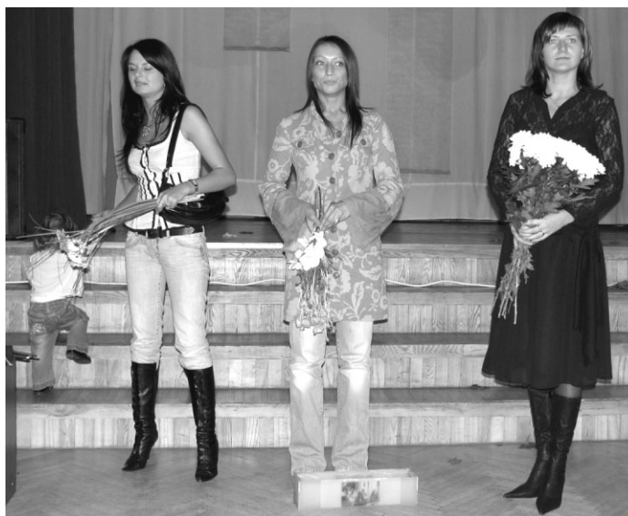
Atmiņu uguntiņu, jaukus vārdus, laba vēlējumus un skaistus ziedus skolai dāvina paša pirmā izlaiduma meitenes