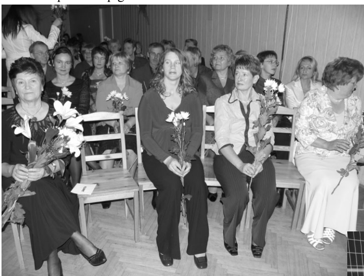
Svētku vakarā skolas pedagogi un darbinieki

Jau 20 gadus abas iestādes ikdienā strādā blakus un arī svin svētkus kopā. Un kopīgā dzīve nenozīmē tikai atrašanos zem viena