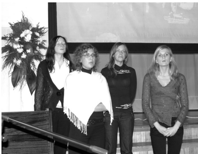
Klātesošos saviņņoja „Pērkonīša” sniegums