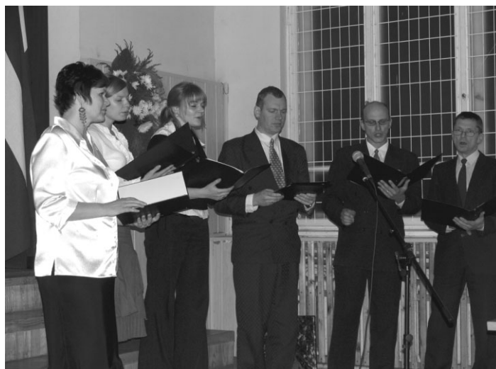
Ropažu kora grupa sveic ropažniekus