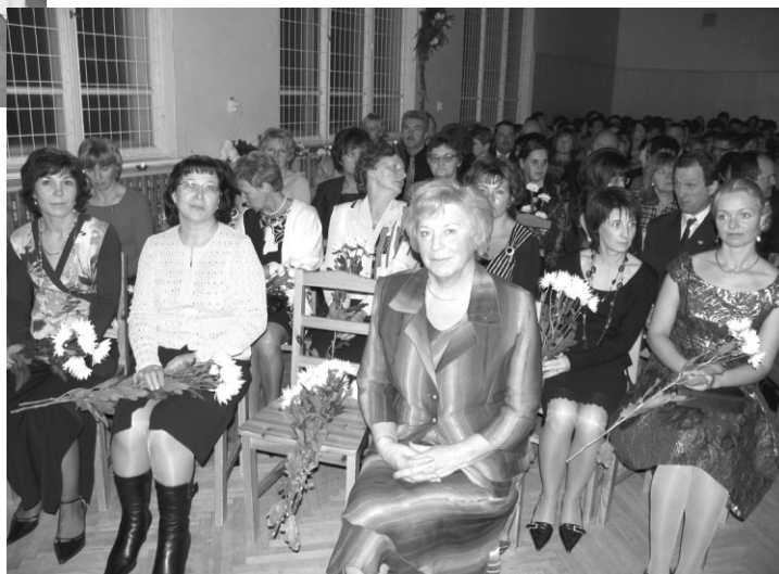
PII „Auseklītis” kolektīvs