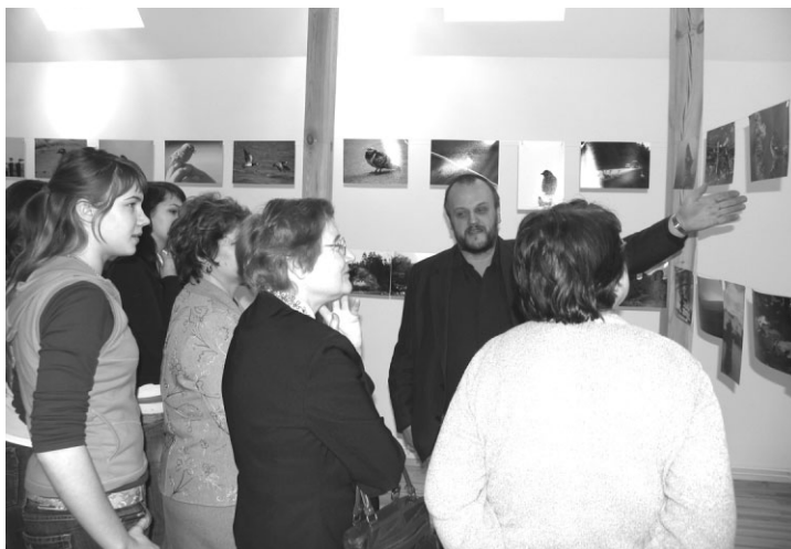
Fotogrāfs Raimonds Rēķis komentē savus darbus