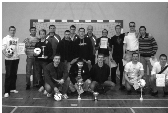
Pirmo trīs vietu ieguvēji pēc apbalvošanas kopā sargāja vienus vārtus