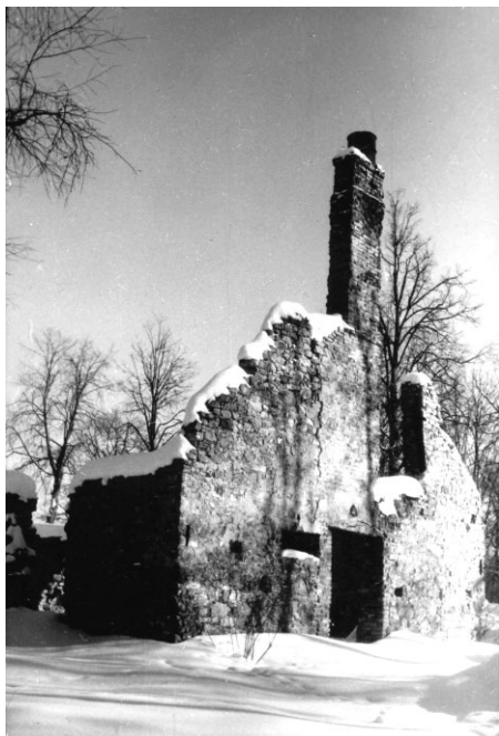
Ropažu tautas nama krāsmatas

...laiks, kad Ropažu kultūras nama vietā tikai drupas, estrāde ieaugusi zālē..., kādreizējos kultūras namos Ropažu ciematiņos (Kākcimā u.c.) klusums, un vēl...ugunsliedzi izpostīts ciemata centrs...Nekā nav?!...Nē! Ir! Kas?