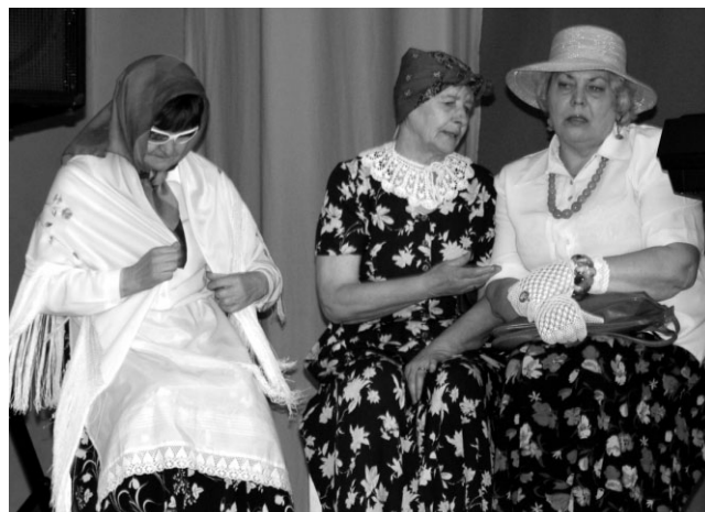
„Trīs vecenītes” Inčukalna viešņu interpretācijā