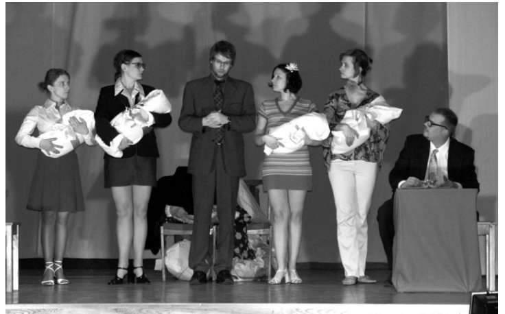
Skats no izrādes „Pirmā sniega sindroms”

viesus un jau pie ieejas bija sarūpējušies iesildīšanās dzērienu malku ar smalkām uzskodu maizītēm.