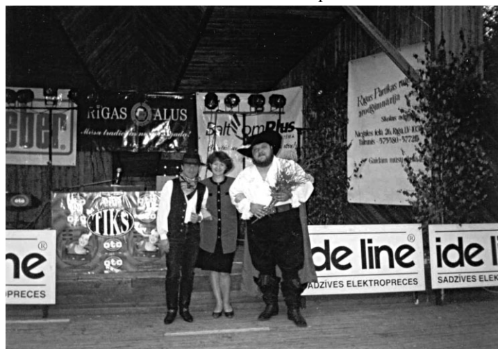
Ropažu estrādē „ziņģēja” ne viena vien slavenība