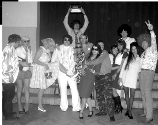
Šie viesi bija ieradušies no Kurzemes

tika pieskaņots tiem laikiem - sākot no šķīvīšiem un glāzēm, uzskodām un limonādes, līdz pat svečturiem un sarkanajām nelķēm vāzēs. Arī deju mūzika atsauc atmiņā aizgājušos gadus.