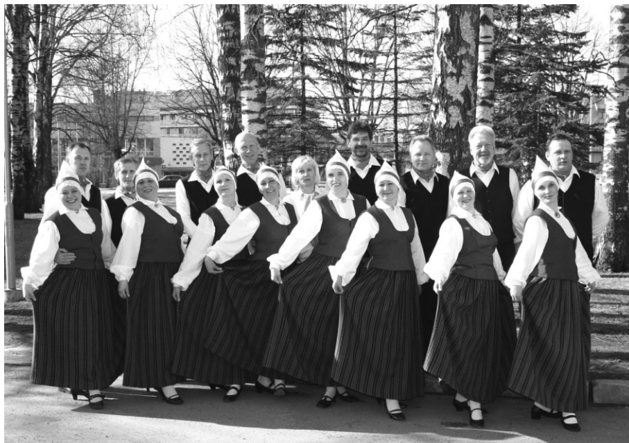
Vidējās paaudzes deju kolektīvs „Cielava” pirms skates. Paldies Ropažu novada korim par izlīdzēšanu ar tērpiem!

“Cielavas dalībniece”, līdzjutēja un fotogrāfe