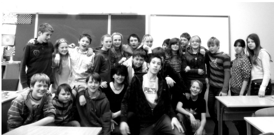
Draudzības dienu organizatori - 7.klase

2. diena – TICIMAN – KOPĀ JAUTRĀK! Draudzības Stafetes.