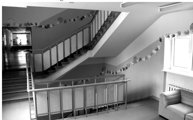
360 draudzīgu plaukstu virknes fragments skolas foajē

Es pats zinu, kā tas ir, kad tevi sit. Tāpēc es iedziļinājos šajā filmā un izjutu visu, kas tur