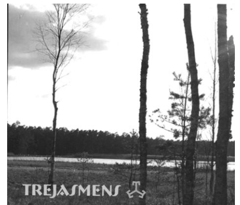
Jaunā CD vāciņš

Tajā skan gan brašas puišu balsis, gan maigs, bet pārliecinošs meiteņu dziedājums. Muzikālais repertuārs ir plašs un savdabīgs tautasdziesmu un tautas mūzikas atspoguļojums līvu un latviešu valodās, kā arī jauniešu pašu mūzikas apdares un