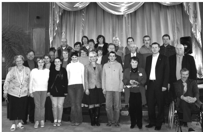
Grupa SAC „Ropaži” darbinieku un klientu kopā ar partijas „Jaunais laiks” pārstāvjiem

medicīnas darbinieci bijušo veselības ministri Circenes kundzi - Saeimas deputāti un aktīvisti dažādās Eiropas Savienības struktūrās. Aprūpes centra