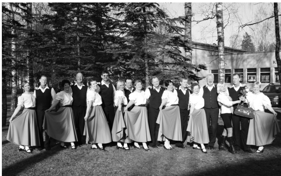
„Pie dzintara jūras” dejojām paši savos jaunajos tērpos