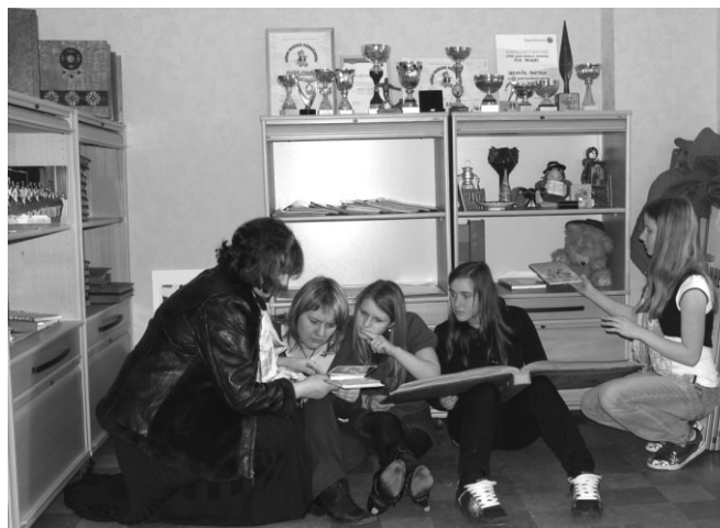
Skatīties vecās bildes ir tik interesanti!

Muzeju var apmeklēt visi interesenti: otrdienās - 15.00- 16.00 un ceturtdienās - 15.30 - 16.30.