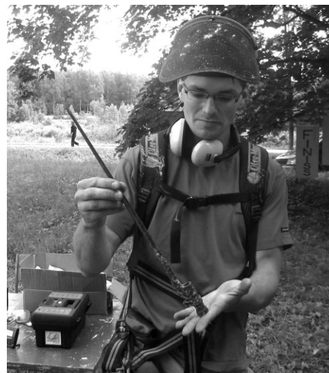
Vēl viens vērtīgs atradums Ropažu pilskalnā

Jaunākā sporta informācija un pasākumu kalendārs