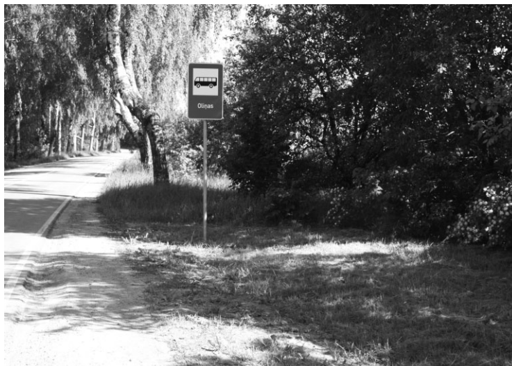
Autobusu pieturas vieta ar soliņu un jau bez tā