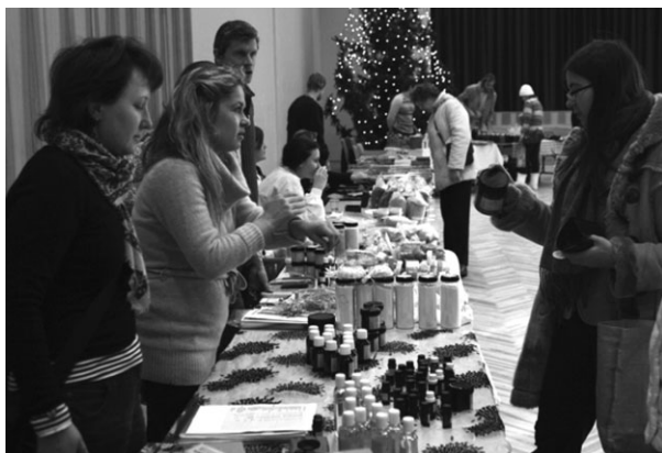
Ieinteresētie pircēji Ziemassvētku tirdziņā