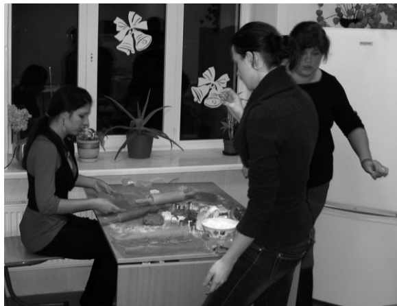
Ropažu vidusskolā top kārumi dāvināšanai