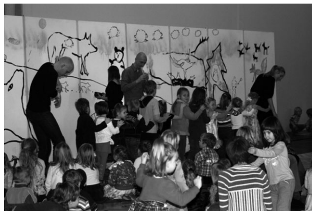
Kupli apmeklētā izrāde bērniem „Vilks”