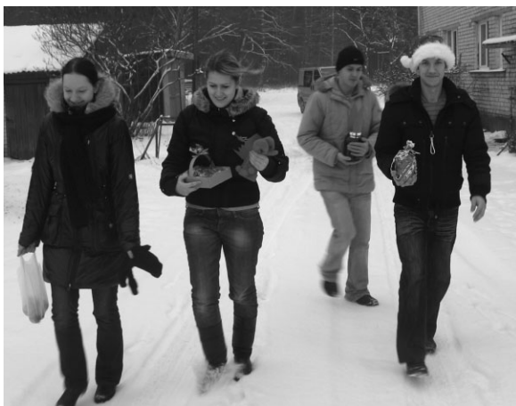
Ar dāvanām ciemos!