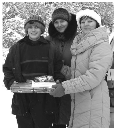
Prieks saņēmējiem un gandarījums dāvinātājiem!

Jums mājās ir kāda sadzīvei noderīga lieta, kura pašiem vairs nav vajadzīga, nemetiet to laukā!!! Īpaši šajā aukstajā laikā daudzām ģimenēm būtu noderīgi silti apavi un ziemas apģērbs.