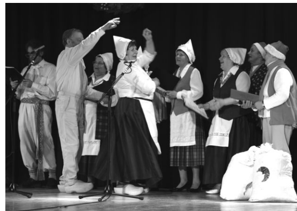
Ansamblis „Sarma” rāda Ziemassvētku pasaku