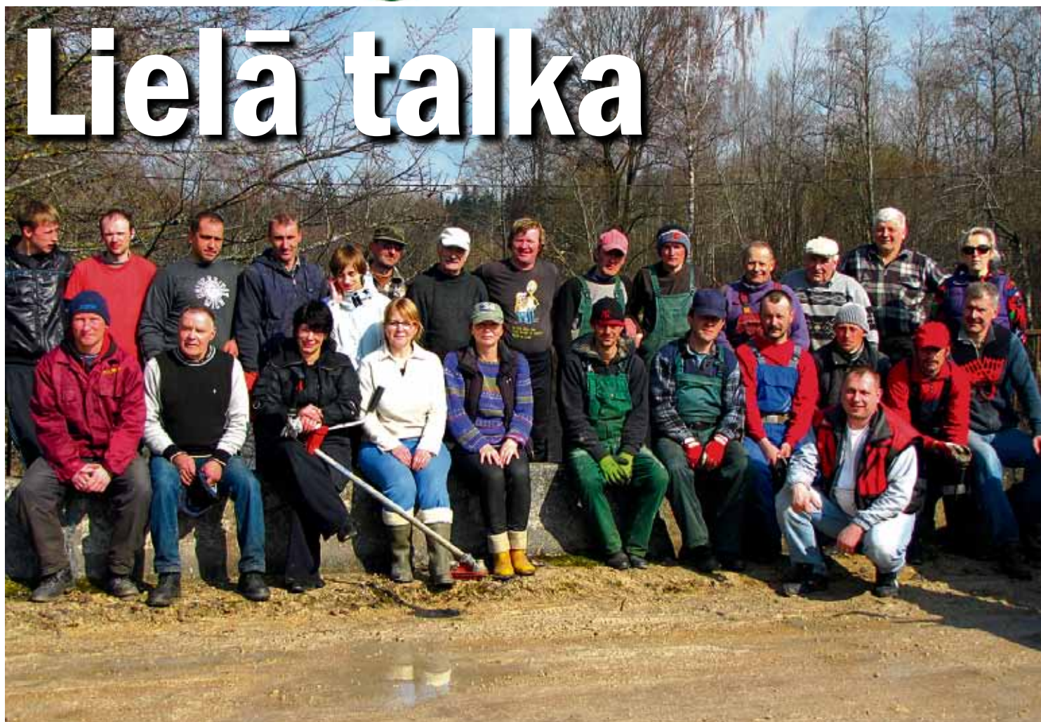
"Ģimenes" bilde uz Laimnieku tilta

Kā saka latviešu paruna – labāk vienreiz redzēt nekā simts reizes dzirdēt. Tāpēc divās lappusēs fotoreportāža no Lielās talkas novadā.