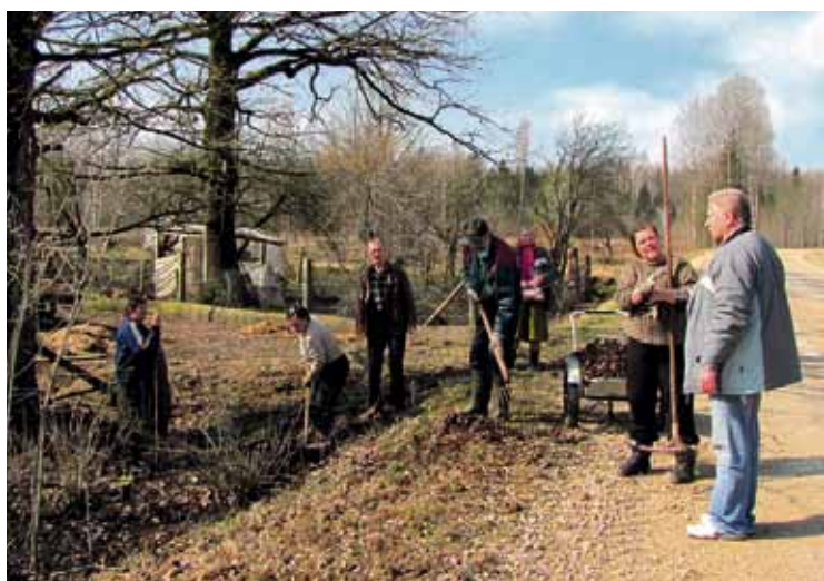
Augšciema stacijas mājas iedzīvotāji arī talko.