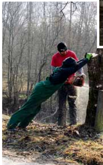
Nav nieka darbs – nozāgēt koku.