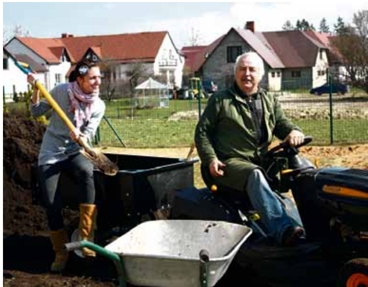
Kā vienmēr aktīvs ir PII "Annele" kolektīvs un bērnu vecāki.