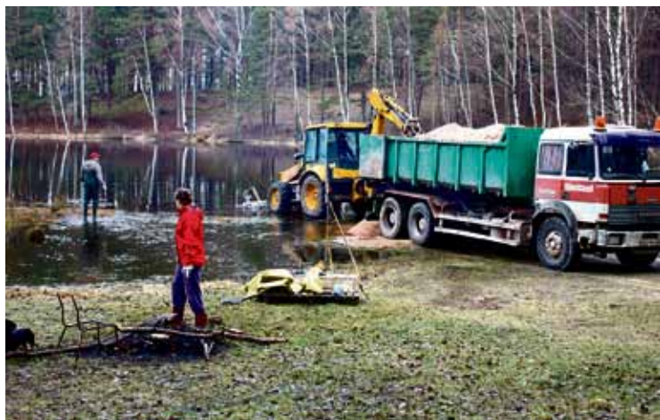
Silakroga pludmales labiekārtošana