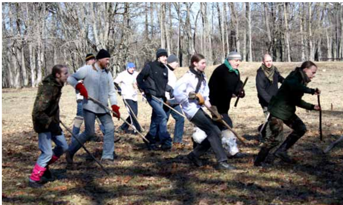
Ropažos norit senās Ripas spēles kausa izciņa.

Svētku svinēšanā ar sagatavotiem priekšnesumiem uzstājās arī Ropažu novada deju kolektīvi "Annele", "Zaķubērni", "Garauši", vidējās