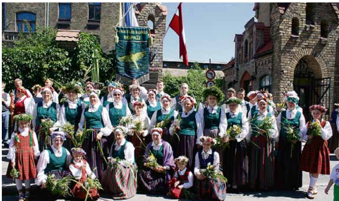
Jauktais koris “Ropaži” un draugi: “Tagad uz Mežaparka estrādi, uz lielo Noslēguma koncertu “Ligo!”