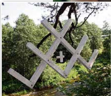
Austras zīme, kuru iekarināt palīdzēja suns

lai turētos un stāvētu ilgāk nekā gadu. ( Smejas. )