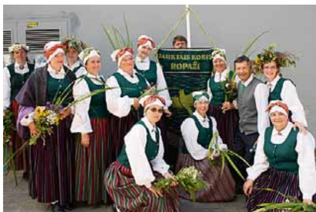
Sievas un vīri no jauktā kora “Ropaži”

23.00 atvērta Kultūras centra brīvdabas kafejnīca visas nakts garumā – sarunas, filmas, dejas, šupūtiķi