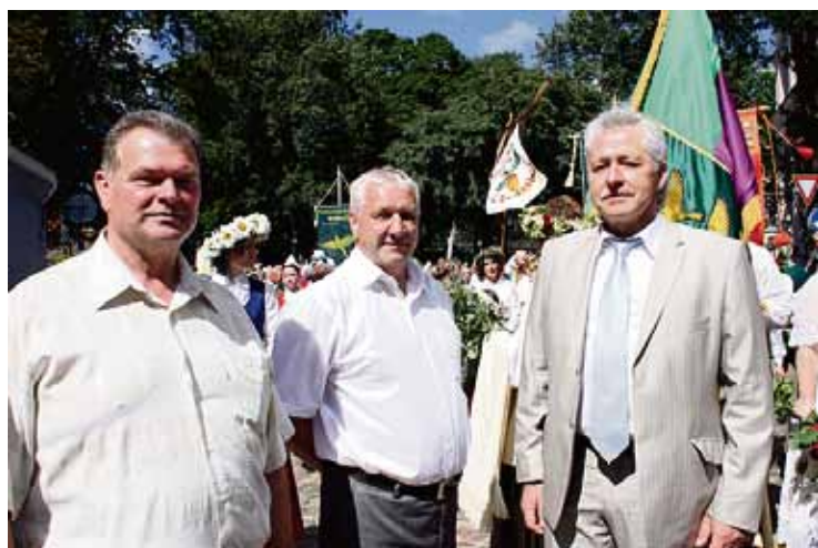
Ropažu novada domes vadība ir gatava. Gājiens var sākties!