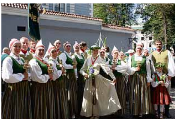
TDK “Cielava” gatavojas Svētku gājenam.