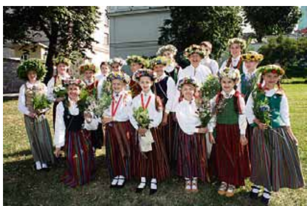
Krāšņi! Folkloras kopas “Oglīte” dziedātāji iekaro Rīgu.