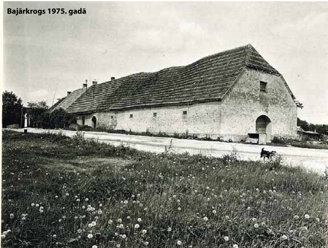
Bajārkrogs 1975. gadā

Krogam gluži kā cilvēkam savs dzīvesstāsts un sava dvēsele. Dažkārt gluži moderna. Ko tik nedarīja reklāmas nolūkos konkurences apstākļos! Bajārkrogs atradās tieši blakus Bajārkalniem Rīgas pusē. Tur spokojās. Briesmīgi spokojās. Gail ceļa malā izdeguša gūnskura ogle, piebrauc klāt – nekā. Nez no kurienes piesitas ceļbraucējam melns taksis, rikšo zirgam blakus soli soli. Uzšauj ar pātāgu, nekā, vien zirgs satrūkstas. Bieži gadījies arī tā. Zirgs iet, iet, iet... braucējs pamostas no snaudas – ne soli tālāk nav tikuši. Turpat, kur iesnauās, arī stāv. Braucēji, saklausījušies spoku stāstus, baidījās no Bajārkalniem, tādēļ arvien, ar ietirgoto naudu kabatā no Rīgas braucot, iegriezās Bajārkrogā. “Degvielu” uzpildīt, iedrošināties un lieku reizi paklausīties no paša krodzinieka