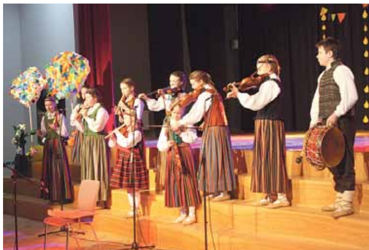
Folkloras kopa „Oglīte”