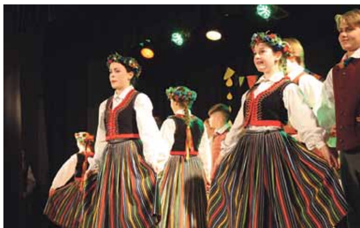
Tautas deju kolektīvs „Garausi”