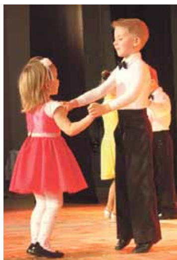
Sporta deju grupa