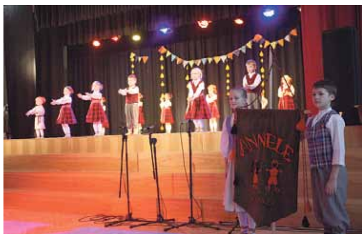
Bērnu tautas deju kolektīva „Annele” jaunākā grupa