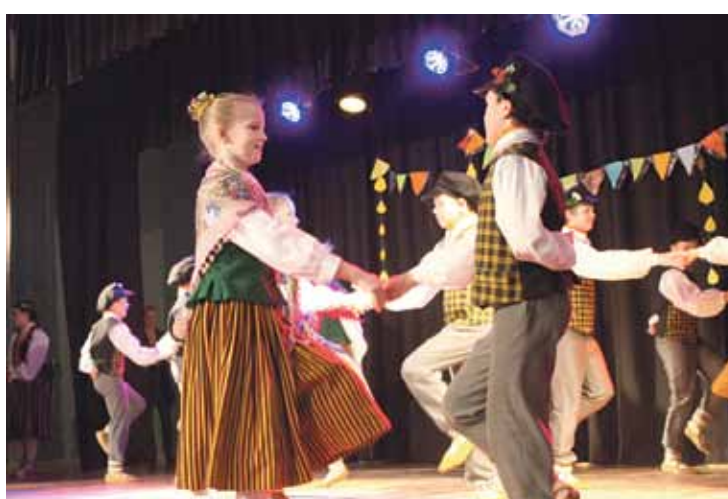
Tautas deju kolektīva „Annele” vecākās grupas dejojāji