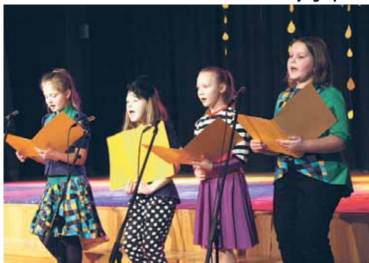
Dzied „Saules zaķi”