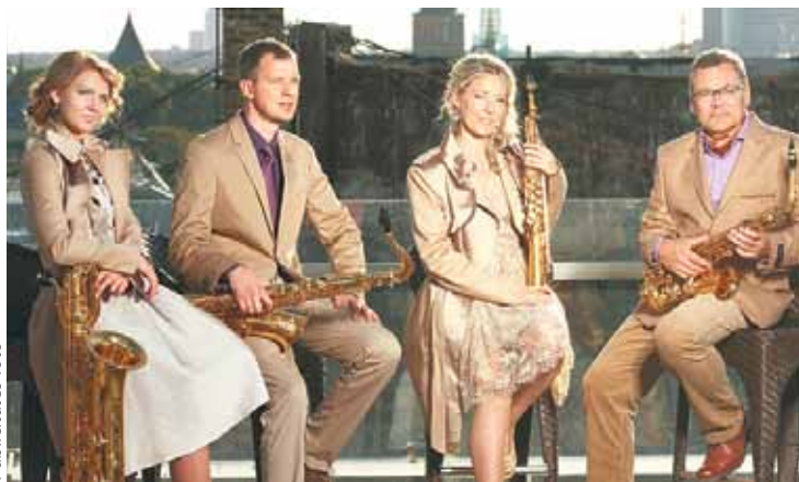
„Rīgas saksofonu kvartets”

Savukārt jau 22. martā plkst. 18.00 Ropažu kultūras centrā, pavasara saulgriežus ieskandinot un