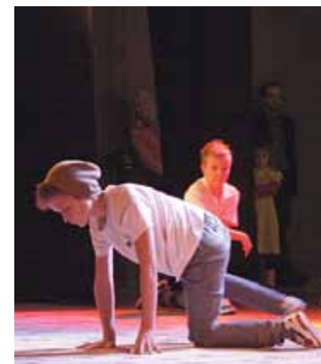
Mūsdienu deju grupa