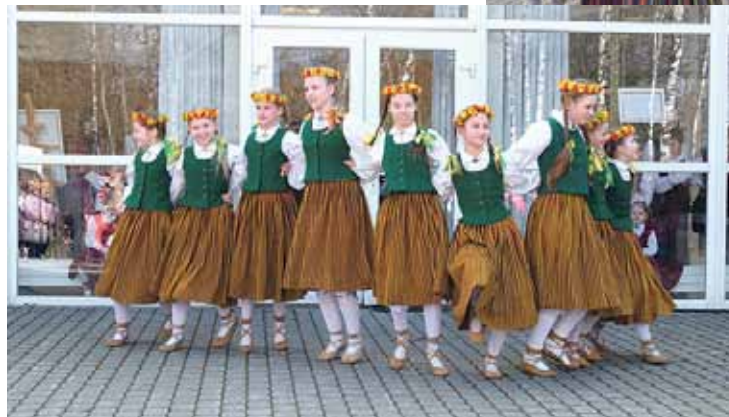
Jaunākās paaudzes dejtāji (pa kreisi)