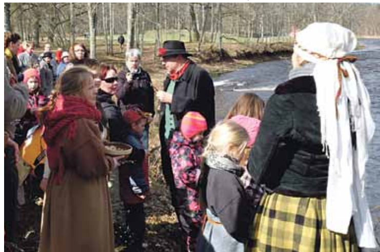
Laba vēlējumi Ropažu novadam