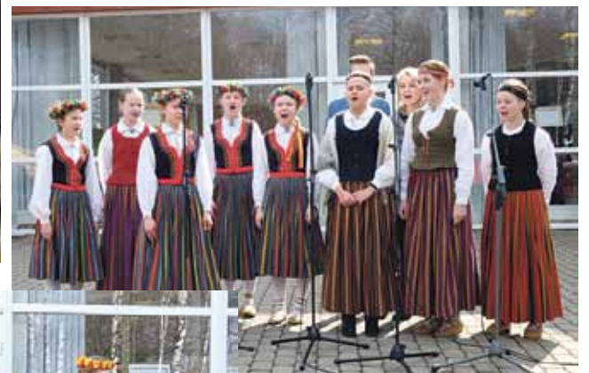
Folkloras kopa „Oglite” (augšā)