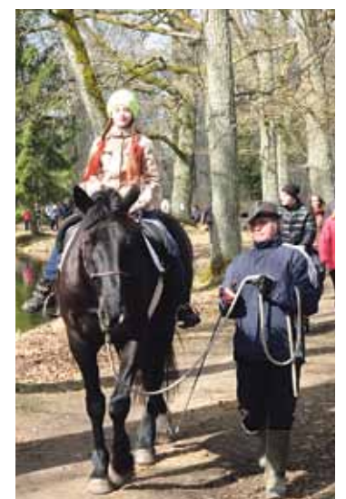
Izjādes ar zirgiem parkā