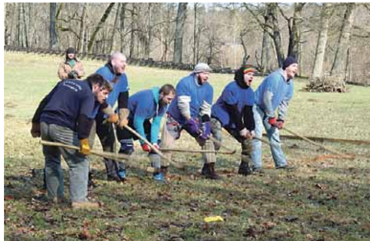
Ripas spēles uzvarētāji „Kangaru purvaini”