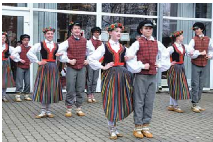
Jaunākās paaudzes dejtāji