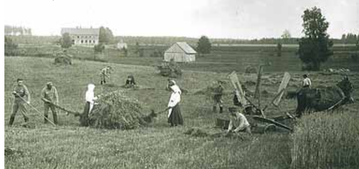
Brīvbrīdī – strēlnieki siena talkā Caunās, fonā Kākciena pamatskola.