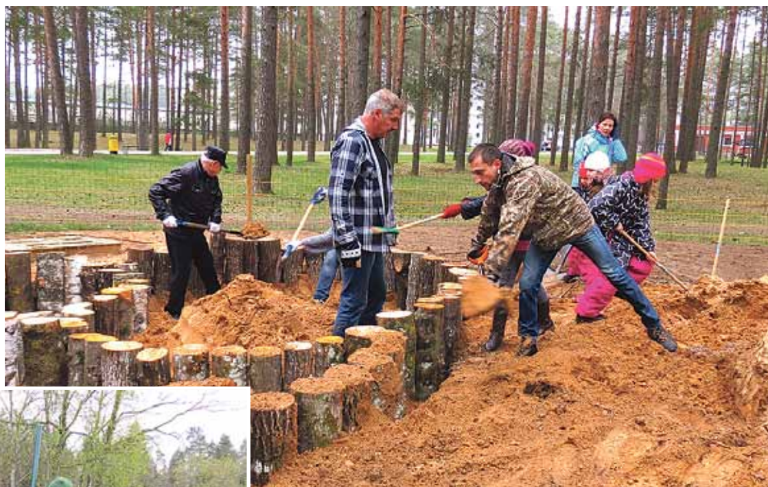
Silakroga apkārtnes sakopšana un bērnu laukuma izveide