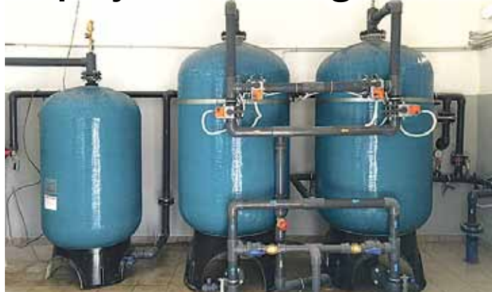
Ūdens atdzelžošanas stacija

Projektā plānotās kopējās attiecināmās izmaksas ir 499 990,04 EUR, no kurām 424 991,53 EUR finansē ERAF. Projekta mērķis ir uzlabot ūdens kvalitāti Silakroga ciemā, kā arī atbilstību visiem Eiropas Savienības standartiem.