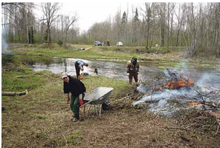
Lielās Juglas krasta sakopšana Augšciemā