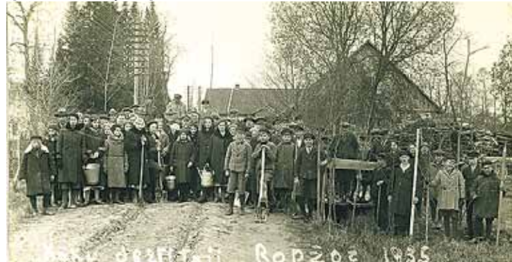
Koku stādīšana Mežu dienās 1935. gadā.