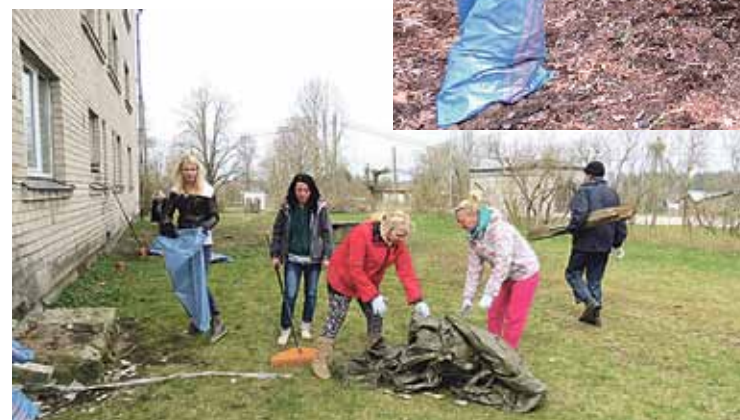
Kārciema apkārtnes sakopšanas darbi