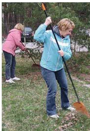
Mucenieku aktīvie talkotāji