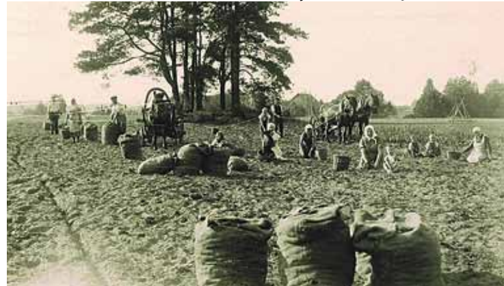
Kartupeļu talka Caunās 30. gados.