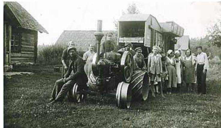
Kulšanas talka Ropažu Lāsās, Leimaņu dzimtsmājās.