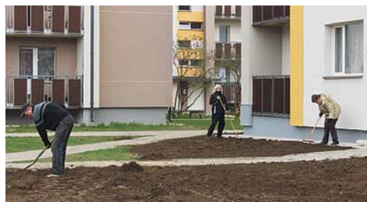
Zaķumuižas piemāju un sporta laukuma labiekārtošana