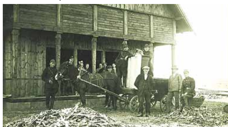
Talkojot cēla arī jauniešu biedrības namu (pēc kara – bijusi pasta ēka).