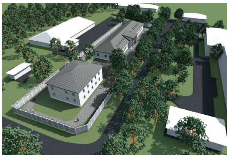
Aizturēto ārzemnieku izmitināšanas centra Muceniekos vizualizācija.

Personas, kurām atteikts bēgļa vai alternatīvais statuss, un izraidīšanas procesa nodrošināšanai