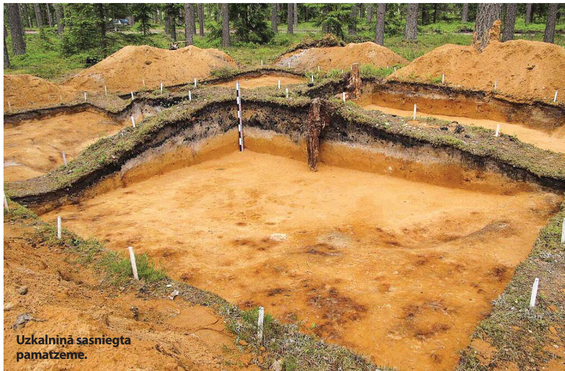
Uzkalniņā sasniegta pamatzeme.

Vēstures pētnieku uzmanība Ķoderu pilskalnam pievērsta kopš 18. gs. otrās puses. 1925. gadā detalizētāku Ķoderu pilskalna aprakstu un topogrāfisko uzmērīšanu veicis pazīstamais pilskalnu pētnieks Ernests Brastiņš. 20. gs. otrajā pusē pilskalnu apsekoju-