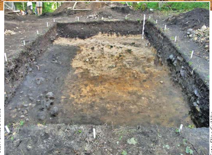
Izrakumu laukumā iezīmēta ēkas konfigurācija.