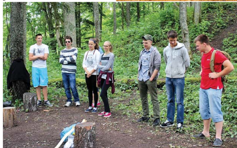
Ropažu vidusskolas skolēni viesojas izrakumos.

Lai precīzi noteiktu laiku, kad šajos uzkalniņos notikusi kokogļu ieguve, daļa no ogļu paraugiem tiks datēta ar C-14 – radio-