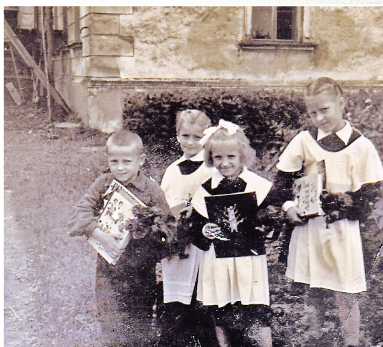
Augšciema skolas skolnieku („Stipnieki”) 1. septembris 1959. gadā. Bildē no kreisās: Stipnieku mājas lielās zāles logs, otrais logs – skolotāja istaba, aiz tās pionieru istaba un klase. Mājas otrā pusē dzīvoja kolhoznieki. Skolu likvidēja 20. gs. 60. gados.