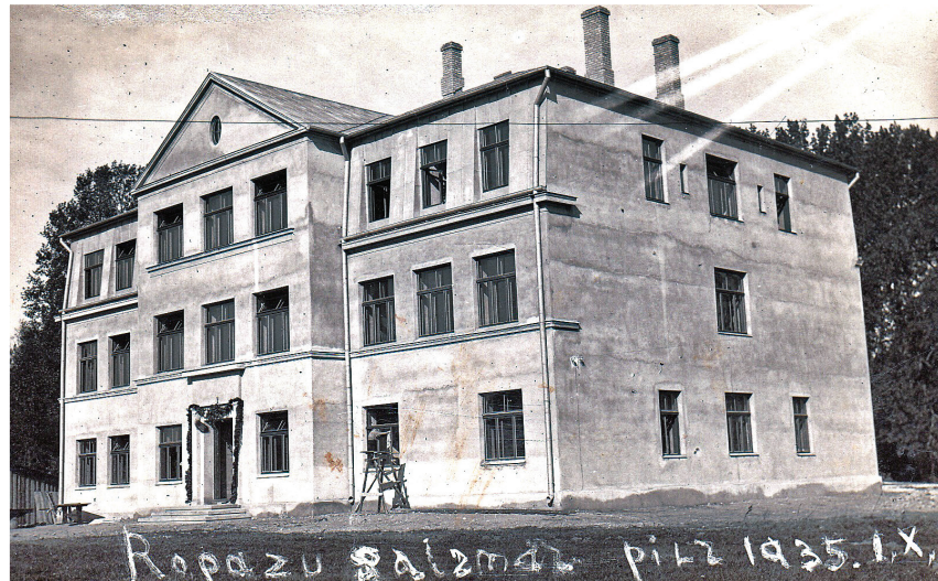
Ropažu pagasta 6 klašu pamatskola 1935. gadā.

pažu vidusskolā tika izbūvēts sporta laukums.