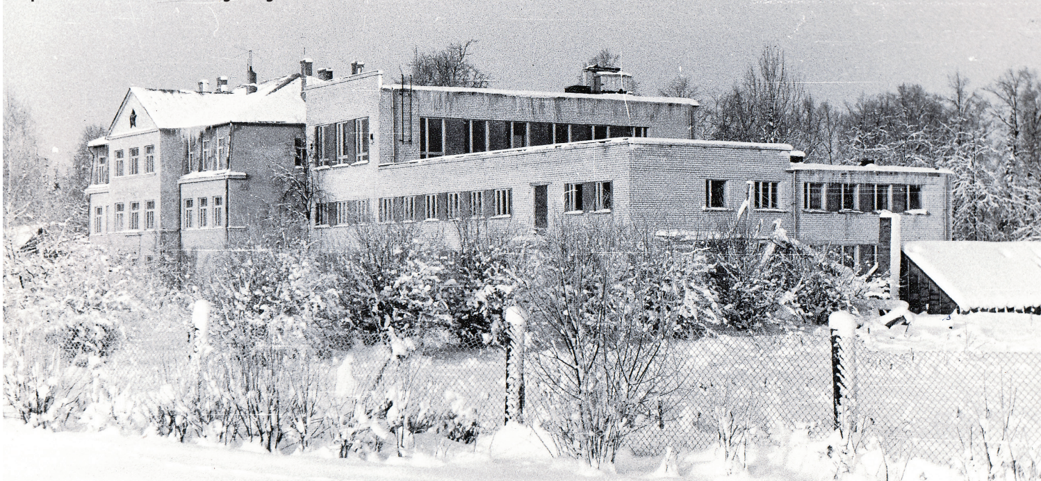
Ropažu vidusskolas internāts 20. gs. 80. gadi.

Palielinoties iedzīvotāju skaitam Ropažu pagastā, 1932. gadā tiek projektēta jauna skolas ēka 150 skolniekiem. Tās celtniecība izmaksāja 63 000 latu. Daļu naudas, ko ieguldīja skolas celtniecībā, ieguva no pašdarbības sarīkojumiem. 12 000 latu katru gadu Ropažu pagastam par mežu iemaksāja Rīgas pilsēta.