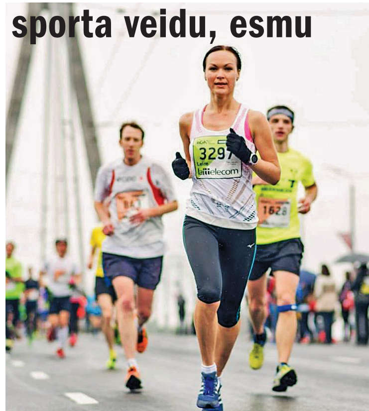
Mani mīļākie laikapstākļi – sacensībās auksts un liets. „Rīgas Maratons” 2015.

skrienu tikai priekā pēc, bet tu gan tikai uz rezultātiem ej, tev jau citi mērķi. Man ir tikai viena atbilde – ja man nepatīktu skriet, tad rezultātu nebūtu un, iespējams, pēc pirmā maratona nebūtu to turpinājis. Protams, bez trenera palīdzības es būtu lēnāka skrīšanā un trenētos 2–3 reizes mazāk nekā šobrīd, jo visi treniņi man būtu vienādi, nebūtu arī atskaites punkta un padoma.