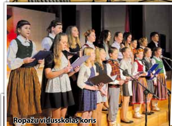
Ropažu vidusskolas koris