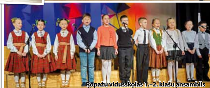
Ropažu vidusskolas 1.-2. klašu ansamblis