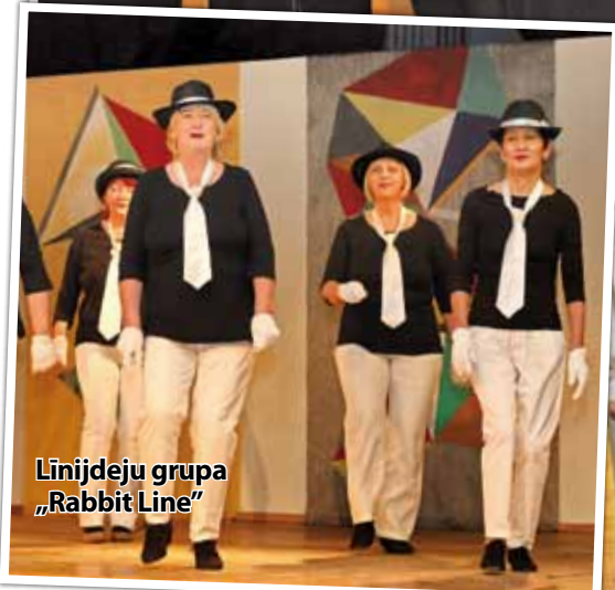
Linijdeju grupa „Rabbit Line”