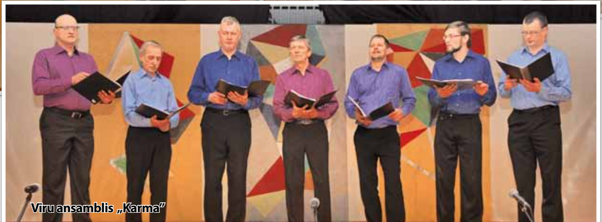
Vīru ansamblis „Karma”