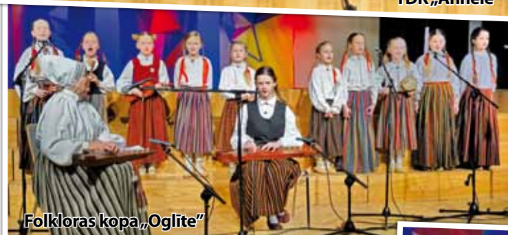
Folkloras kopa „Oglīte”