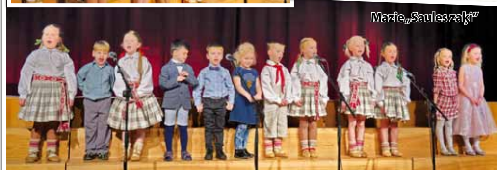
Mazie „Sauls zaķi”