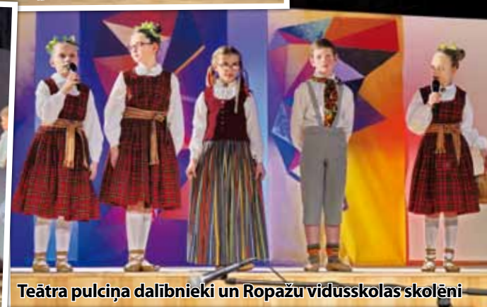
Teātra pulciņa dalībnieki un Ropažu vidusskolas skolēni