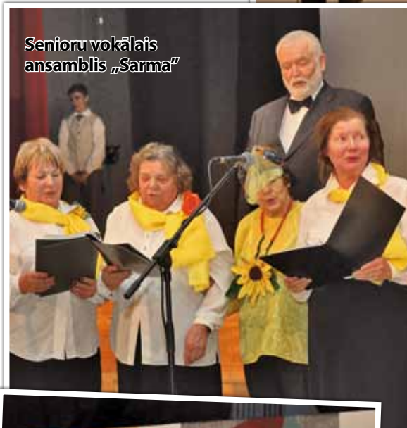
Senioru vokālais ansamblis „Sarma”