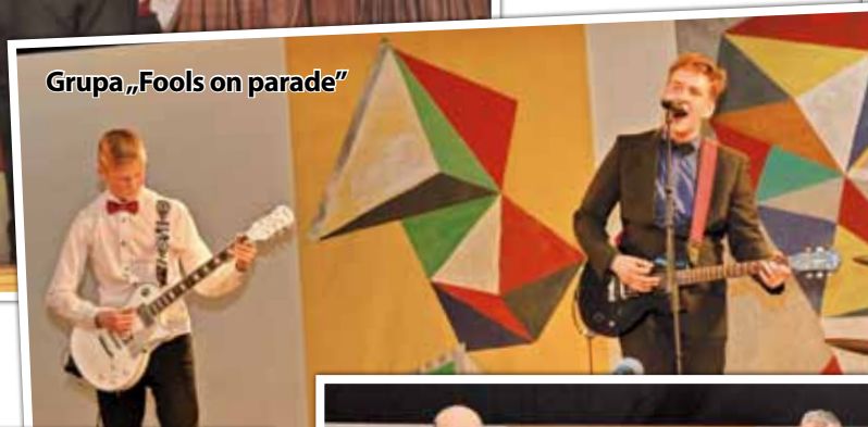
Grupa „Fools on parade”