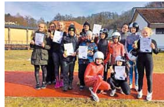
Ropažu novada jaunie kamaniņu braucēji 4.03.2017. pēc Starta rāvienu sacensībām Siguldas mākslīgā ledus seguma estakādē, kurās startējām ļoti labi, jo gandrīz katrs brauca mājās ar izcīnītu kausu un diplomu.