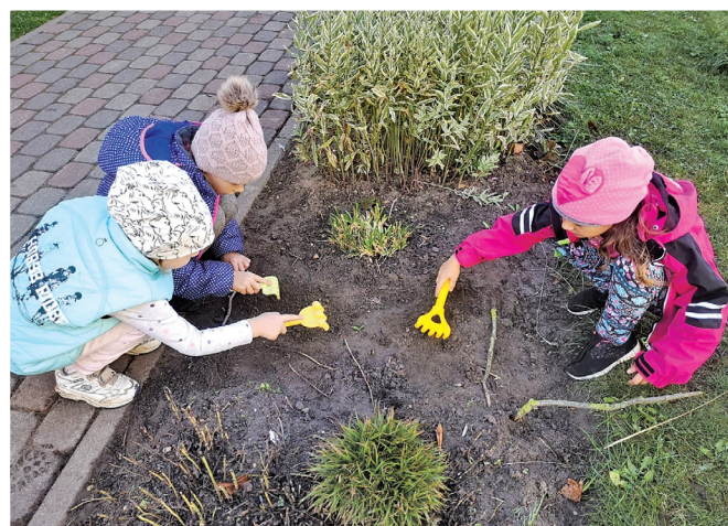
Ropažu novada PIL „Annele”

Sadarbība un atbildīga rīcība šogad ir pirmsskolas izglītības iestādes „Annele” prioritātes. Bērni mācās rūpēties par apkārtni un dabu, strādāt komandā un sniegt savstarpējo atbalstu. Sadarbīgojoties skolotājiem, vecākiem un atbalsta komandai, mācību laikā tiek nodrošināts atbalsts individuālai bērnu izaugsmei.