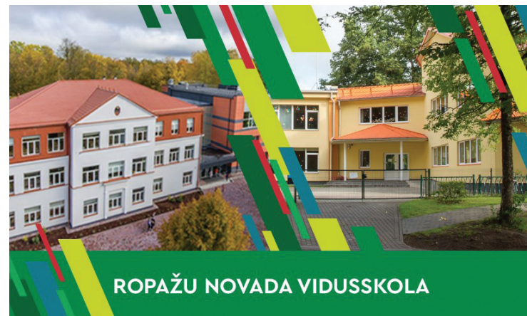
ROPAŽU NOVADA VIDUSSKOLA

Plkst. 15.00 Tumšupe; Kārciems–Silakrogs;