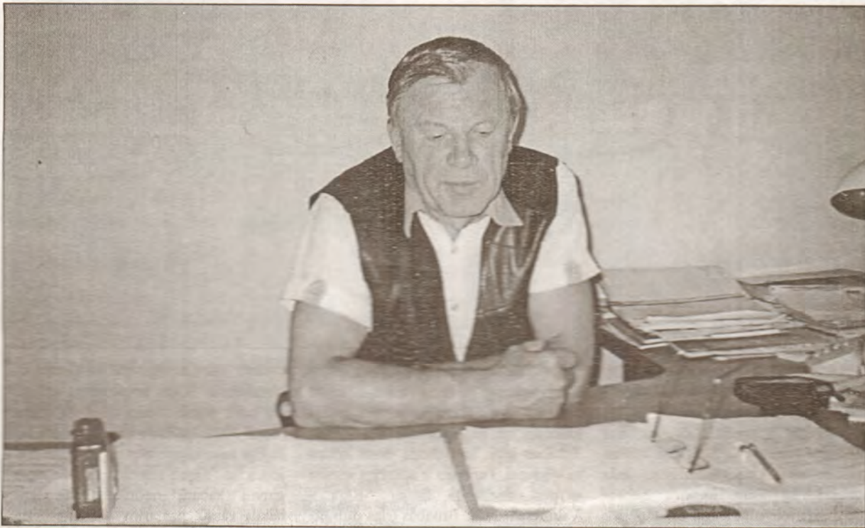
Mēs nekādā ziņā neatteiktos iedzīvotājiem palīdzēt, ja viņi savstarpēji vienotos, samestu naudu un dotu mums pasūtījumu, piemēram, veikt remontdarbus pagrabā.

A.K.: Esmu saņēmis zināmas garantijas no SIA "Saulkrastu