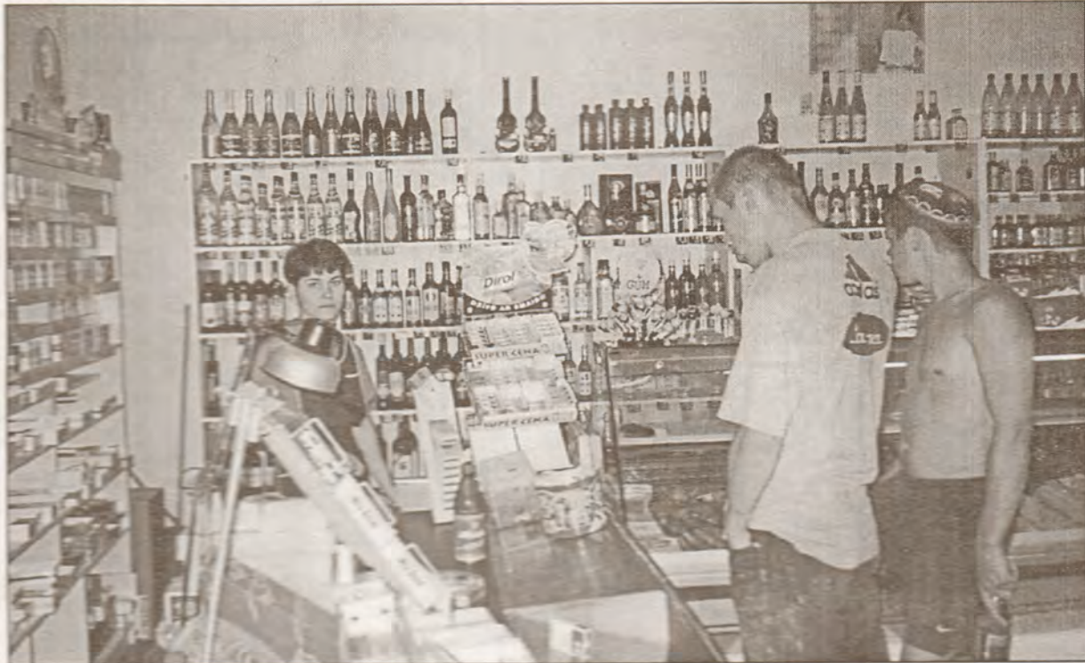
Varu uztāties kā pareģis un prognozēt, ka ilgi šāda veikaliņu bīdīša Garkalnē nepaliks (četri savā starpā sīvi konkurējoši uzņēmēji - autora pieminētie).

V.T.: Tas ir tik nosacīti - vai runājam par veikaliem vai kases aparātiem? Man katrā veikalā ir pa vienam kases aparātam. Kaut gan, formāli rēķinot, Garkalnē man izvietoti četri veikali, pa divi zem viena jumta. Ne jau apjoms ko nosaka, bet spēja pastāvēt. Šobrīd