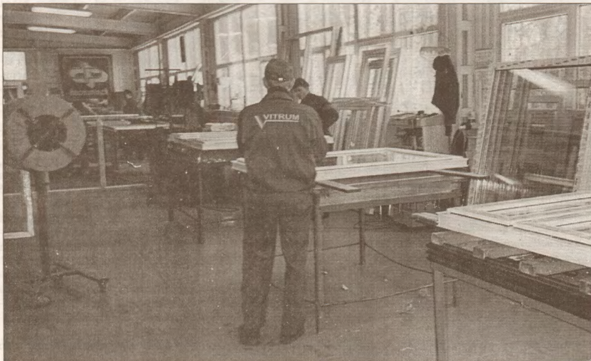
Logu salikšana notiek ļoti rūpīgi.