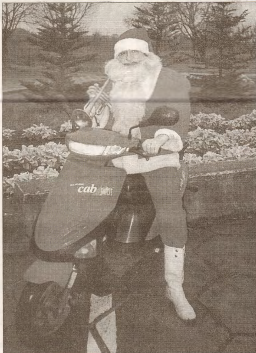
Aināra modernais ziemeļbriedis ir beigts, bet trompete nodota lūžņos.

ciša gaitas, pēc kāda parauga darbojaties?