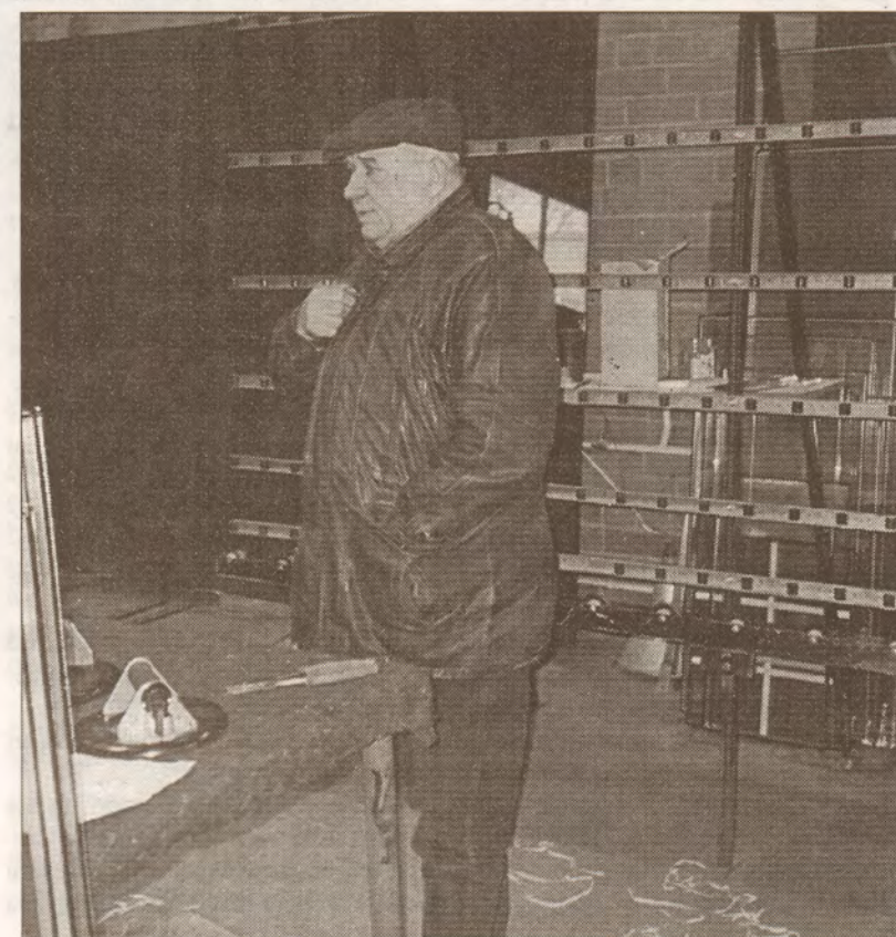
Īpašnieks uzmana darbus katru dienu.

Fonds «Saules smaids» un «Neatkarīgā Rīta Avīze» rīko labdarības akciju «Dāvināsim bērniem - veselību» zvanot pa tālr. 9006288 Jūs ziedojat 11 latu Bērnu Klīniskās slimnīcas Reaminācijas nodaļai.