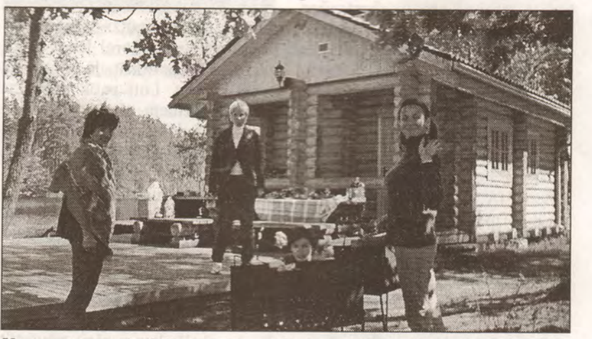
Vasaras terasē vienlaikus varot sasēdināt ap 100 cilvēkiem, šogad izveidošot arī nojumi.