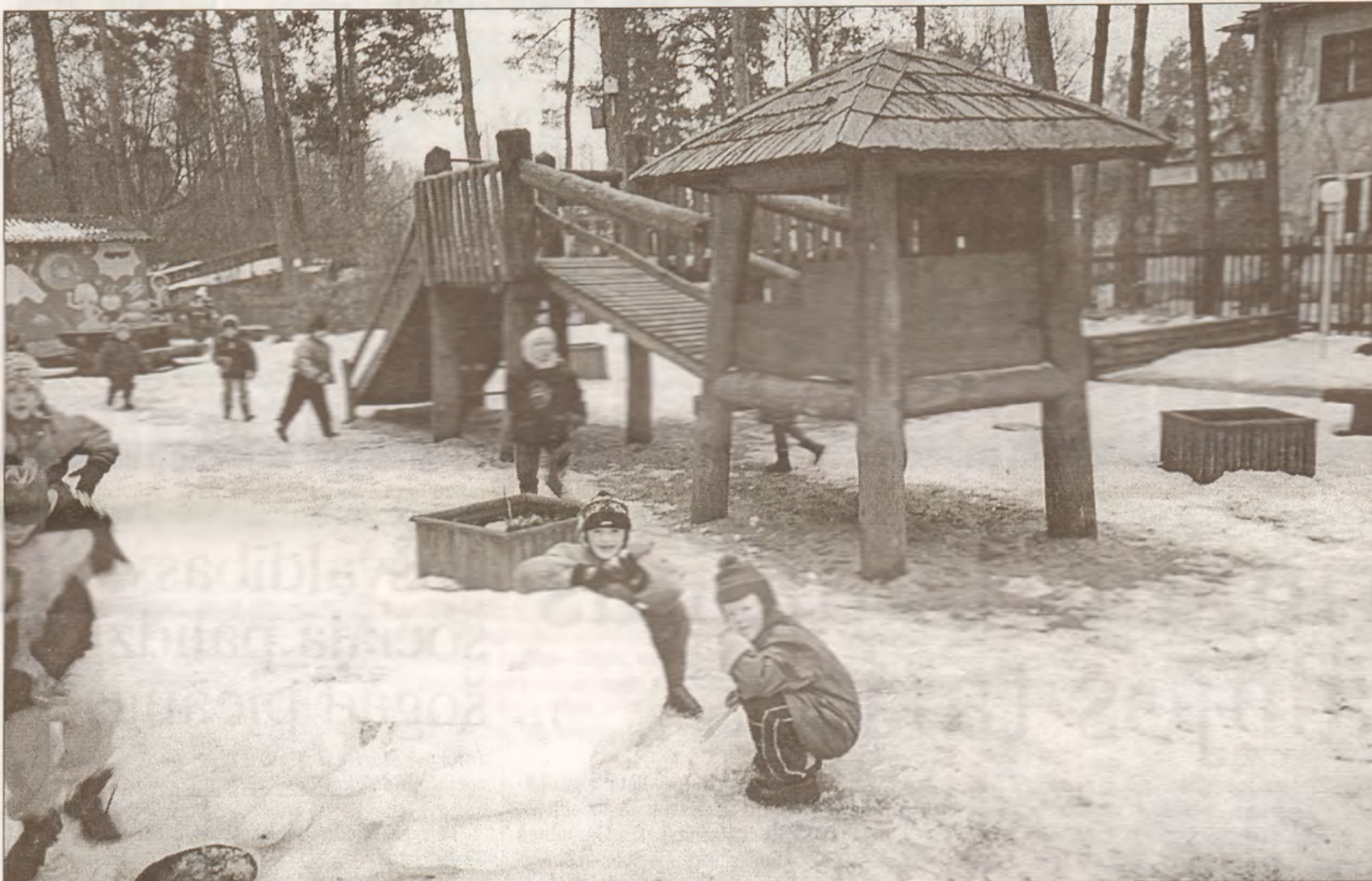
Šī rotaļu pilsētiņa ir iekārtota par 1000 latiem.

1935. gadā ekspluatācijā nodotā baltvācieša – kūku cepēja privātmāja (vasarnīca), kura kā bērnudārzs Saules ielā 34 darbojas kopš 1954. gada, tuvākajos gados piedzīvos savu otro jaunību. Tā nebūs kosmētiska smiņķa uzklāšana šai vecmāmiņai vai parūkas (šinjonā) pagatavošana, bet tā iedzērs mūžīgās jaunības eliksīru... Proti, vispirms esošo ēku siltinās un nostiprinās tās pamatus, pēc tam veiks piebūvju celtniecību un teritorijas labiekārtošanu, ko noslēgs pašas fasādes sakopšana.