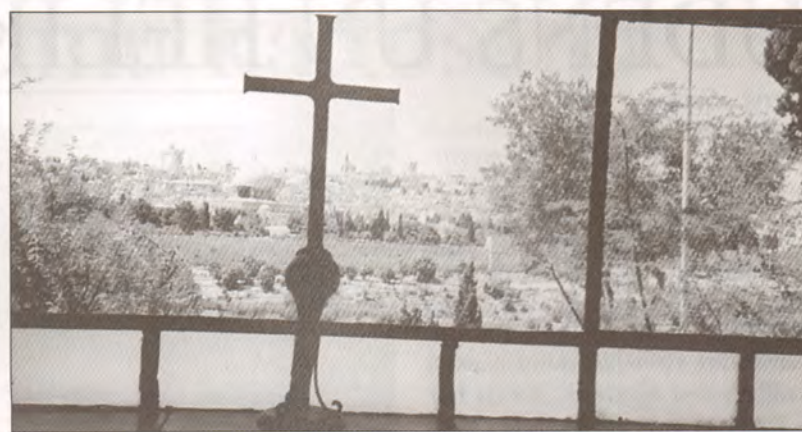
Skats no „Dominus Flavit” kapelas, kurai altārglezņas vietā ir logs ar skatu uz