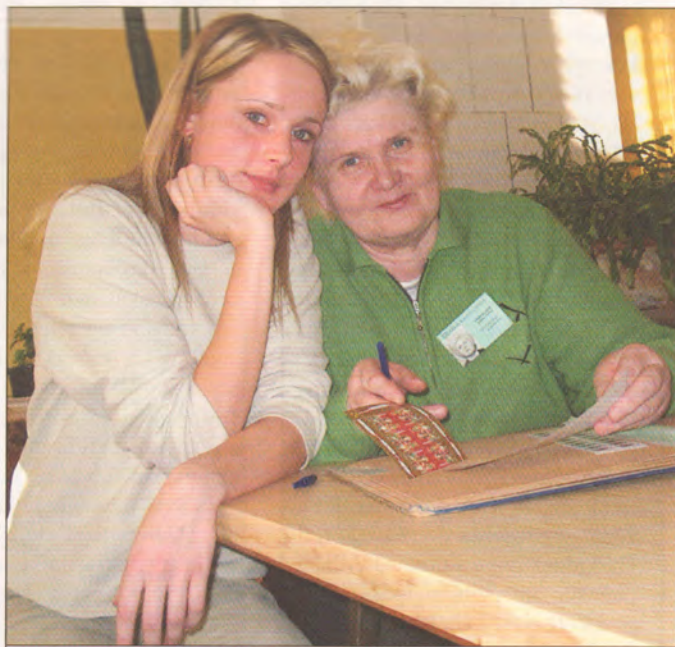
Kopā ar mazmeitu Lindu, kura neklātienē studē vēsturi un omei palīdzot pasta darbā jau no 5 gadu vecuma.

Atvadoties Jākobsona kungs nāca klajā ar paziņojumu, ka „Rīgas ūdens” nākamgad izdos grāmatu „Ūdens apgādes 100 gadi”, kurā iekļaus plašu viņa stāstījumu par vēsturiskajiem faktiem, un dāvāja lasītājiem kalambūru, kas kā čūska ķer pats savu asti: „Jo mazāk aizmirst, jo vairāk zina; jo vairāk zina, jo vairāk aizmirst; jo vairāk aizmirst, jo mazāk zina; jo mazāk zina, jo mazāk aizmirst...”