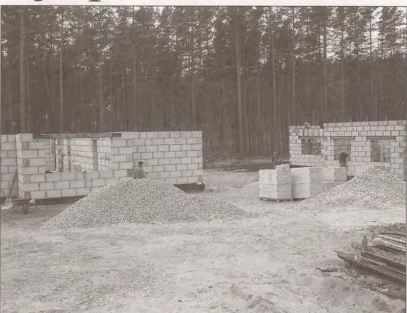
Tā te izskatījās 2003. gada 30. septembrī, jo vairāki draugi būvējās vienlaikus.

Garkalnes birzī ir vieta 8-10 mājām, kur katrs jaunais īpašnieks pats veiks savas teritorijas apzaļumošanu, jo gaisā neauglīgā smiltis ir nostumta, varēja pasmelties no kopē-