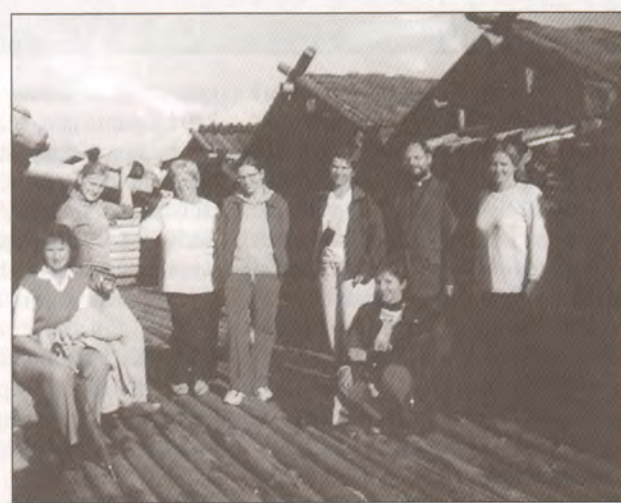
Draudze pulcējas pie Usmas baznīcas tūlīt pēc dievkalpojuma.

kur tad vēl peldēšanās Tepera ezerā! Draudzes liturģiskais ansamblis gaida jaunus dalībniekus – pieteikties pie Ievas