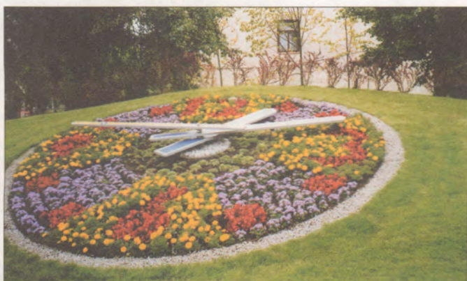
Ināras Reimanes teksts

Noreibusi un žigla steidzas vēsīgā vasara. Kuram gan negribas kādu laiku pavadīt šalčošos mežos, dārzos, druvās un pie jūras? Tāpēc dodamies tālos ceļos, kuri aizved uz Ziemeļkurzemi. Mūsu maršruts - Rīga - Kolka - Mazirbe - Dundaga - Ventspils - Talsi - Rīga.