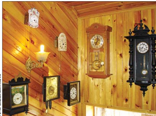
Kolekcionārs atzīst, ka lieli pulksteņi kolekcionāru aprindās tiek salīdzināti ar lepniem sugas suniem, ar kuriem liela pēnšanās, bet vienkārsākie, kuri nākuši no Švarcvaldes, kā kranci – mīļi, sirsniņi, visiem tikami.