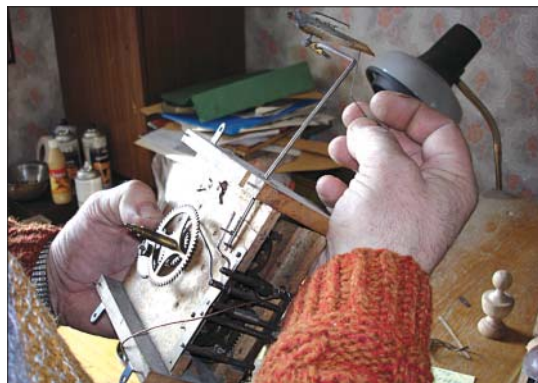
Šādi izskatās pulksteņa mehānisms, kas vēl ir labošanas procesā.

lerice, ar kuru panākta dzeguzes kūkošanas imitācija. Izrādās, tas ir neliels cilindriņš, kas, ievēlot un izpūšot gaisu, rada "ku-ku" skaņu.