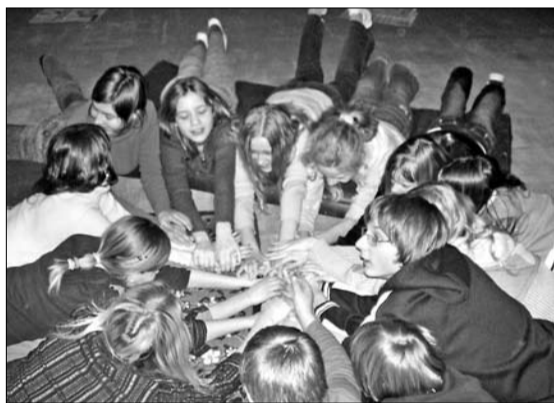
Viens par visiem un visi par vienu...

Šoreiz kopā pulcējās savstarpēji mazpazīstami skolēni, tāpēc nerisinājām nopietnas sabiedrības problēmas, bet vairāk pievērsāmies sevis izpētei. Interesanti likās gan grupas biedru ieteikumi, kā risināt problēmas, kas ikdienā traucē dzīvot, gan