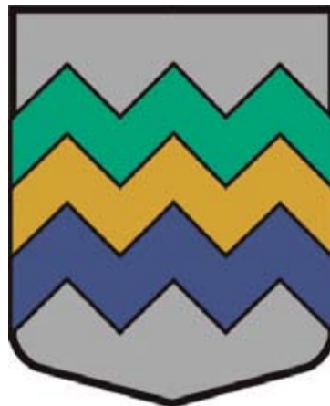
Garkalnes pašvaldības oficiālā simbolika.