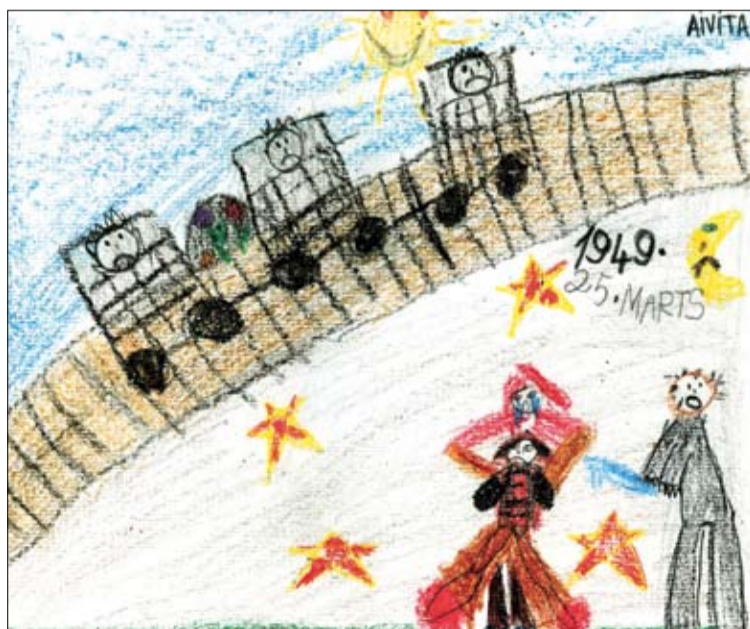
Aivitas zīmējums – iedzīvotāju izvešana 1949. gada 25. martā.