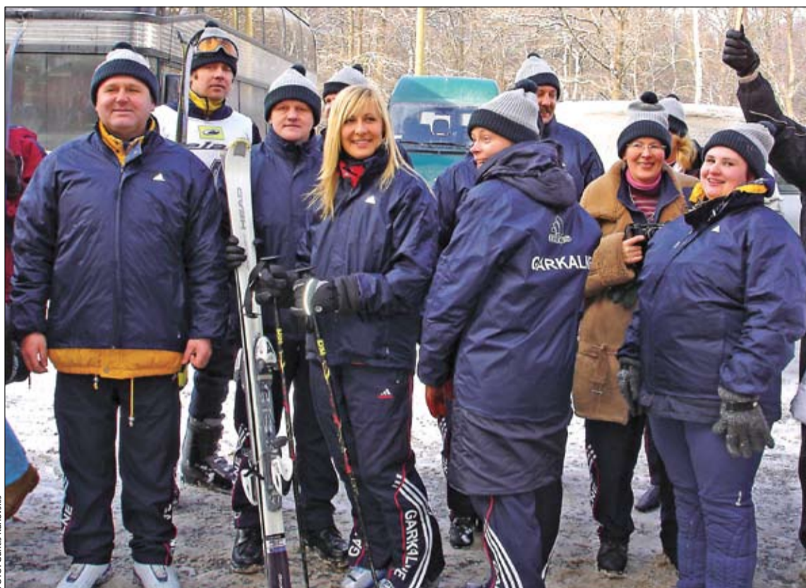
Šādi izskatījās lielākā daļa Garkalnes pagasta padomes komandas – skaistos tērpos.