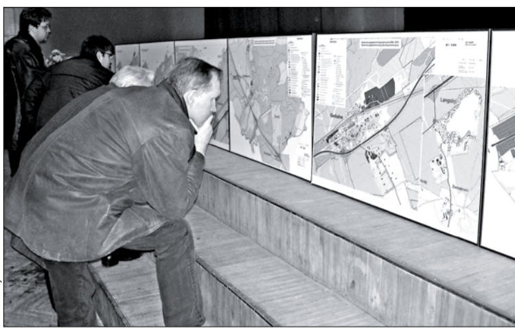
ledzīvotāji ieinteresēti pētīja teritorijas plānojumu, lielāku uzmanību pievēršot savas apdzīvotās vietas perspektīvām.