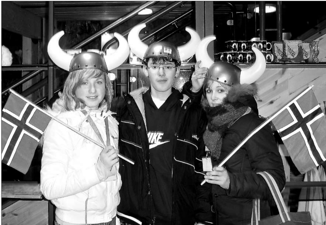
Norvēģijas suvenīri – karodziņi un cepurītes ar ragiem – liecina par to, ka kāds pabijis Skandināvijas zemē. Šoreiz tie bija Garkalnes un Berģu skolas skolēni.