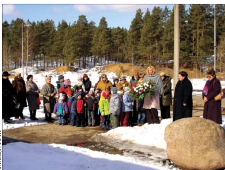
Cilvēki pulcējās pie piemiņas akmens, lai noliktu ziedus un godinātu tos, kuri izsūtīti uz Sibīriju.