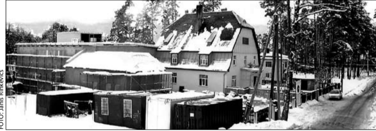
Šādi bērnodārzs izskatās no mūsu loga, kad sasniedz liels un balts sniegs.

Nu jau vairāk nekā pusgadu pirmsskolas izglītības iestādes "Skudriņas" vecākā sagatavošanas grupa mīt Garkalnes pamatskolas telpās. Kā mēs šeit jūtamies? To jau vislabāk var pateikt paši bērni.