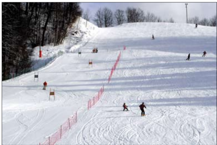
Nožogotā trase, pa kuru nobraucienā ar slaloma slēpēm devās katras pašvaldības pārstāvji, izbraucot piecus līkumus.