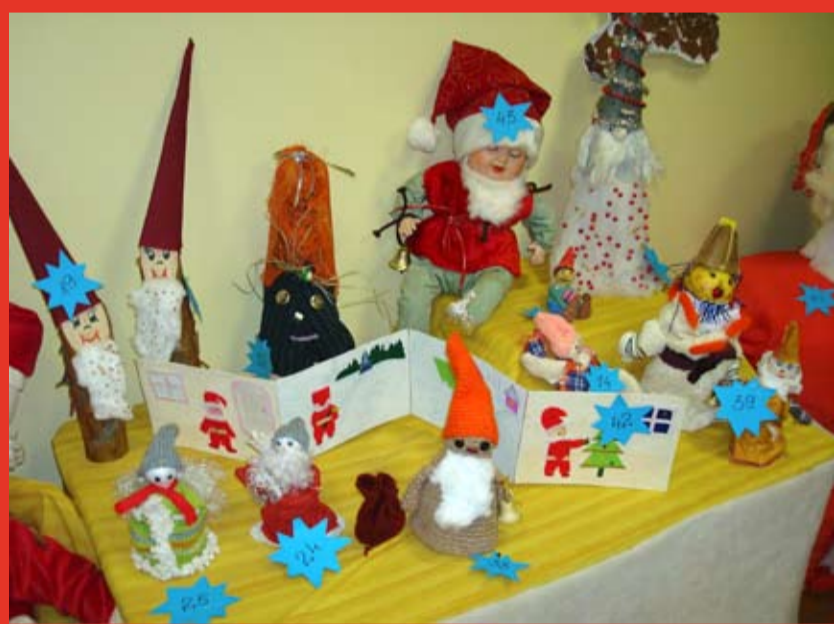
Paraug, šādus rūķišus spēj izgatavot pirmsskolas izglītības iestādes "Skudriņas" bērni kopā ar vecākiem.

Tie ir lieli brīnumi – ko tik bērni nespēj izdarīt kopā ar vecākiem! Tieši šādā sadarbībā tapuši Rūķu balles dalībnieki. Trīs līdz septiņus gadus veci bērni kopā ar vecākiem veidoja dažāda lieluma un materiāla rūķus – no folija, dzijas, audumiem, tamborētus, zīmētus, no