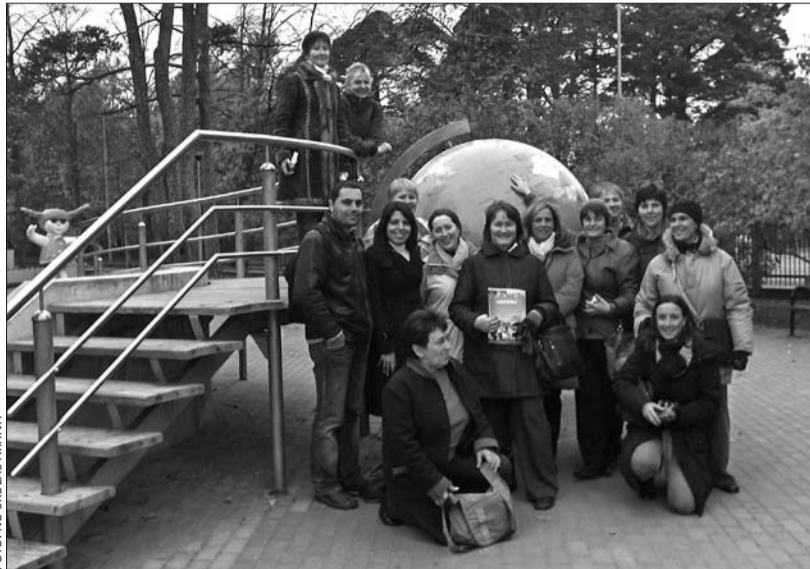
Projekta "Comenius" viesu delegācija jauki pavadīja laiku, tostarp kopīgi fotografējoties.

Nedēļa iesākās ar koncertu Garkalnes pamatskolā, kur ciemiņus priecēja līnijdejojotājas un mazie tautas deju mīļotāji, lieli un mazi dziedātāji,