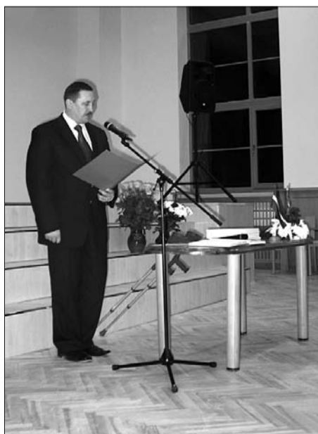
Garkalnes novada domes priekšsēdētājs par spīti veselības problēmām uzrunāja klātesošos un sveica Latviju 89. gadskārtā.