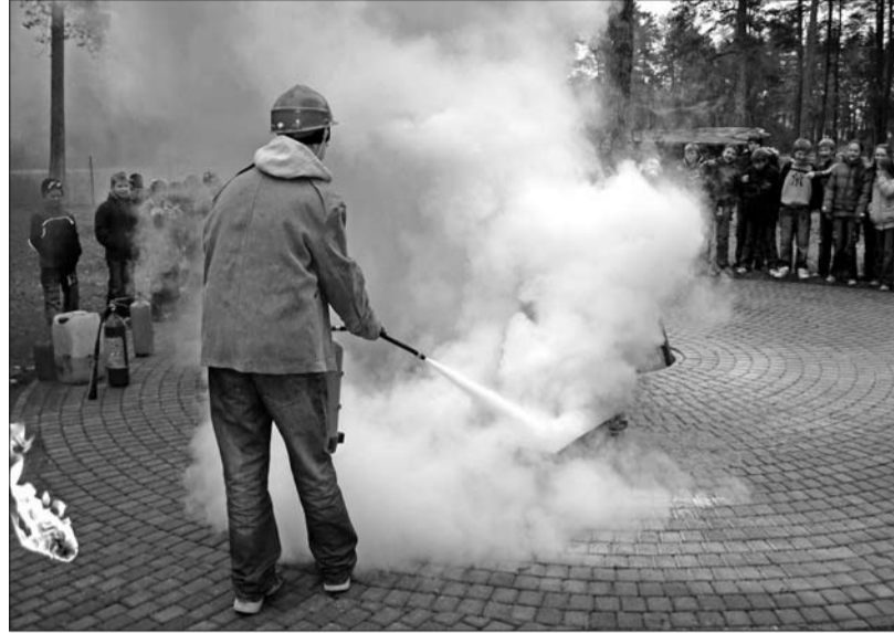
Pietiek tikai ar vienu kafijas tasīti degvielas, lai rastos milzīga uguns liesma.