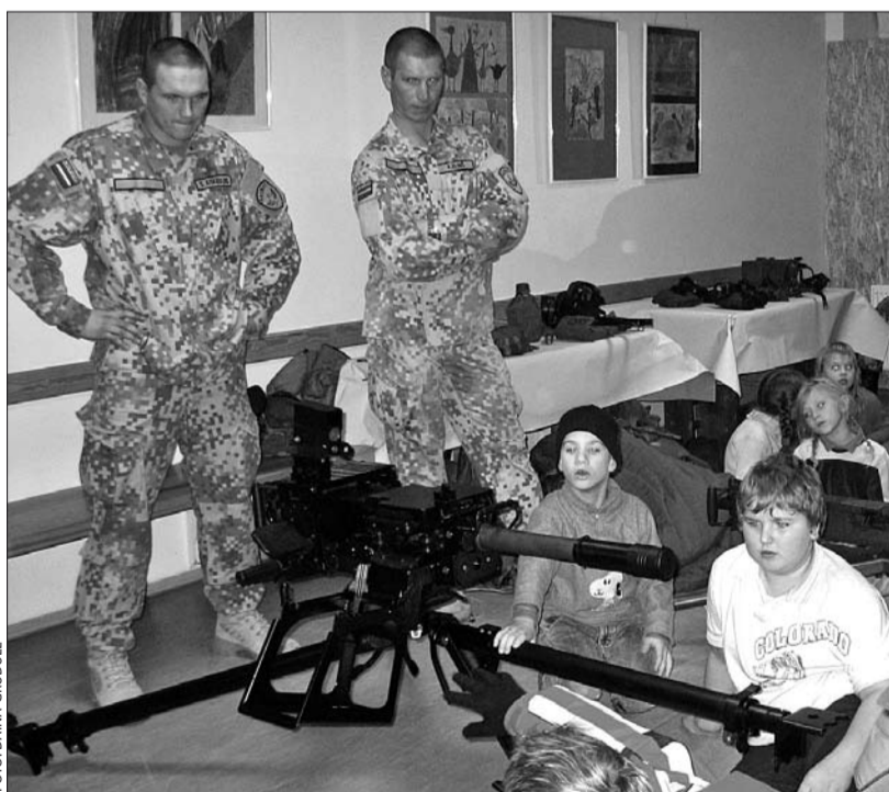
Skolēni ar lielāko prieku un interesi pētīja atvestos ieročus, par kuru lietošanu tika uzdots milzum daudz jautājumu.

Pēc militārās stundas visi devās ārā, lai gatavotos stafetes skrējienam pa Garkalnes novada ielām. Lāpām izgaismotajās ielās bija izvietoti 14 kontrolpunkti. Katrā no tiem skrējējus atbalstīja Zemessardzes 19. bataljona pārstāvji. Šogad bez pamatskolēniem komandās startēja arī ciemiņi no Brocēnu vidusskolas un Sauszemes spēku kareivji. Lai gan laika apstākļi nevienu nelutināja un nemitīgi lija lietus, visu četru komandu skrējēji bija ļoti apmierināti un cīnījās līdz pēdējam likumam un pagriezianam. Sevišķu sajūsmu skolēnos izraisīja kareivju skrīšanas veids, jo viņi zibenīgi sasniedza finišu.