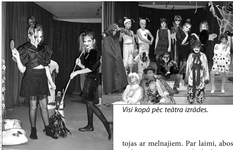
Nu gluži kā mazās raganiņas.