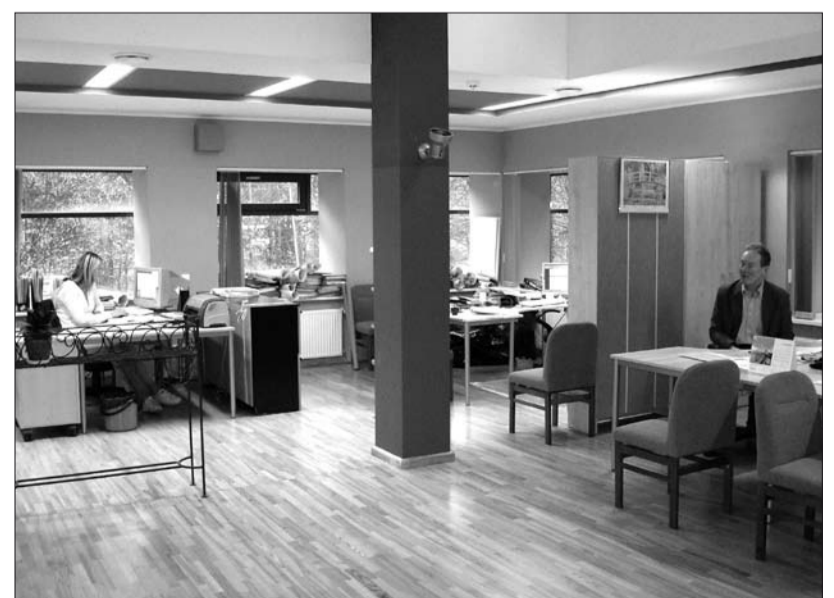
Jaunās būvvaldes telpas – atvērta tipa darba vietas.