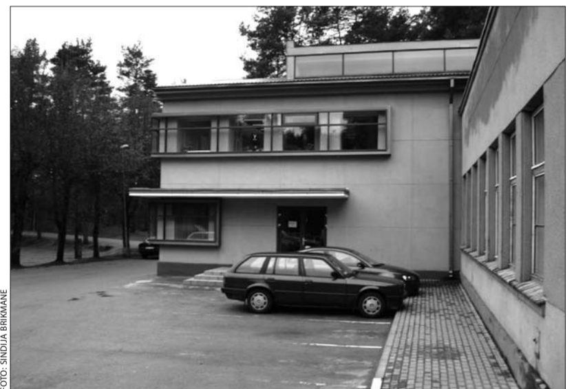
leja būvvaldē pa kreisi no Garkalnes novada domes centrālās ieejas.