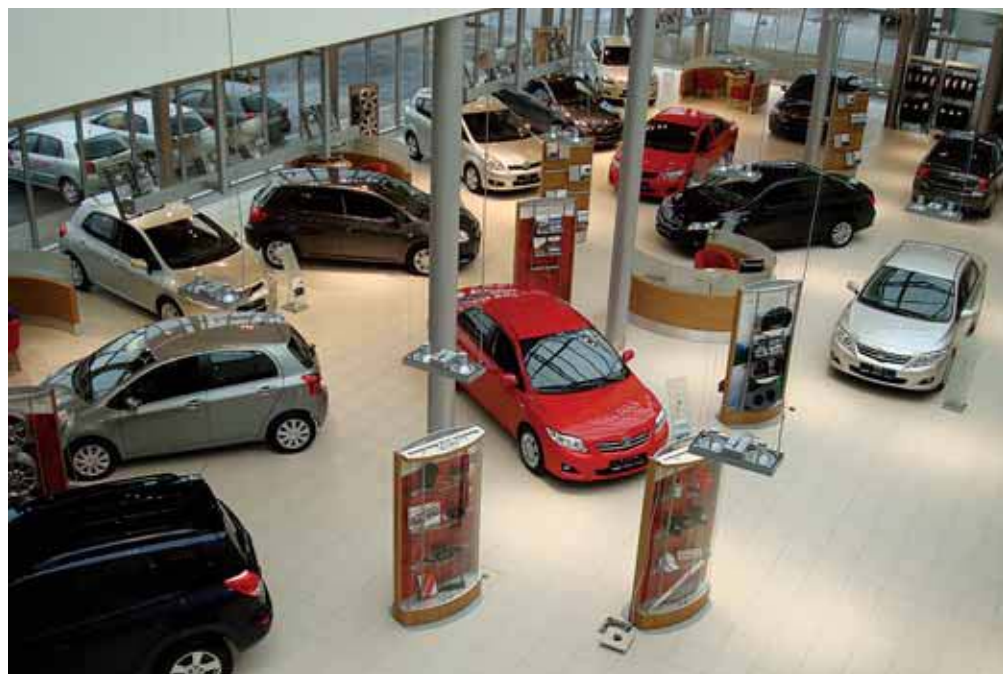
Jaunie auto Toyota salonā