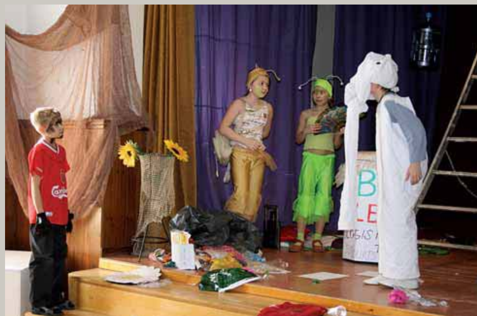
Sarkanais āboliņš, / Tārpi tavu sakni grauž; Smuks puisītis baltu muti, / Tas meitām sirdi grauž. (Kukainijas jampadracis – 5. lpp.)

“Garkalnes novada vēstis”, Nr. 68 Brīvības gatve 455, Rīga, LV-1024