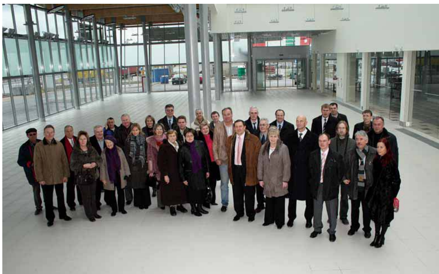
Atklāšanas svētku viesi