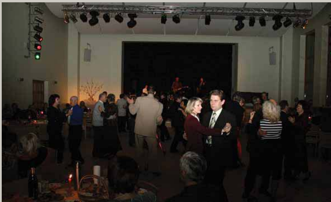
Dziedātāju sievu ņēmu, / Dancotāju kumeliņu; Dziedāj' mana ligaviņa, / Dancoj' manis kumeliņš. (Valentīna dienas balle)