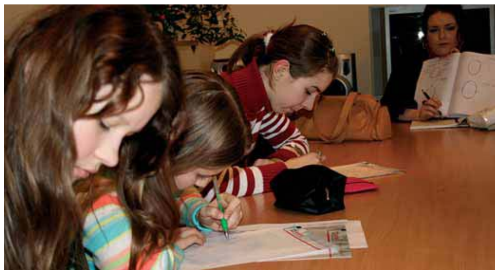
Meitenes kārtīgi pieraksta krāsošanās noslēpumus