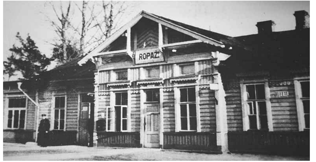
Vecā Ropažu stacija