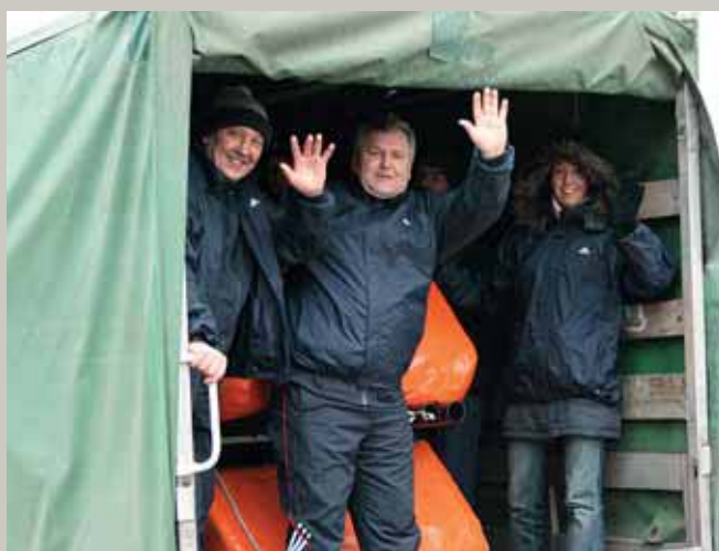
Braucin brauca augšās ļaudis, Zviedzin zviedza kumeliņi; Mūs' māsiņa dzeltainīte Tikko līdzī neaizgāja. (Garkalnes dome bobsleja čempionātā)