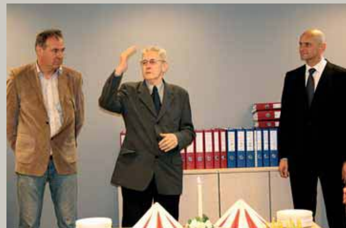
Dzēsim alu, dziedāsim, / Ko mēs klusu stāvēsim; Mīsim zirgus, atmīsim, / Ko bez darba darīsim. (Augstās runas Toyota centra atklāšanā)