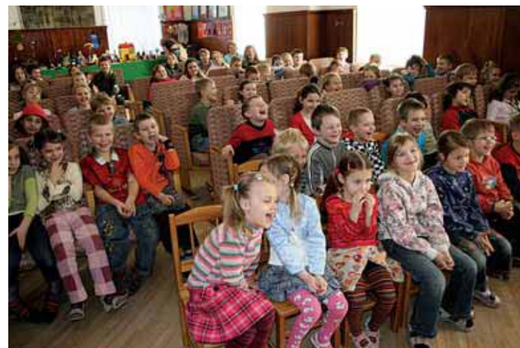
Priecīgie lugas skatītāji un izstāde fonā