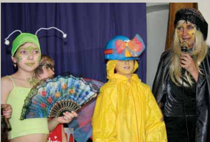
Sveši ļaudis lielījās, / Manu kaklu aiztaisāt. Vaļā durvis, vaļā logi, / Vaļā mana valodiņa.