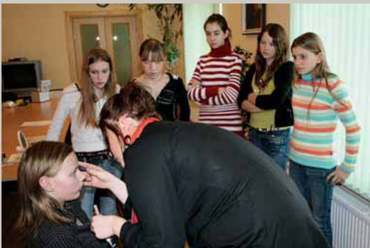
Jaunas meitas kroņus pina No rozīšu lapiņām; Jauni puīši raudziņās Caur rozīšu lapiņām. (Rūžu un smiņķu skola Dienas centrā)