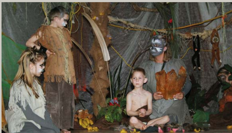
Trīs gadiņi ganos gāju, / Pelniņ' zvēra kažociņu Vilka ādas, lāča ādas, / Aizpērnāja kumeliņa. — Mums viena asins – Tēv un man – 4. lpp.