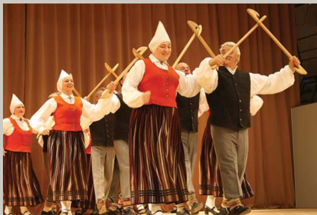
Sader miezis ar apini, / Sa zālīte ar ābolu; Sadereja mātes meita / Ap tautieti tēva dēlu. — Es mācēju danci vest – 3. lpp.