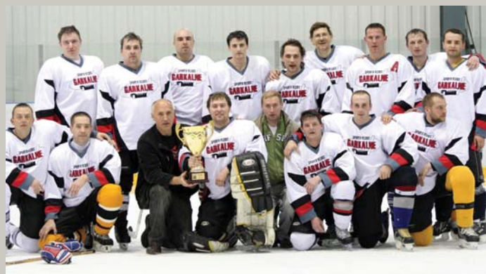
Muižas kunga pagalmā / Kupli, resni ozoliņi; Tiem vajaga asu cirvu, / Gudru vīru cirtejiņu. — NAHL komanda Garkalne 2001 – 5. lpp.