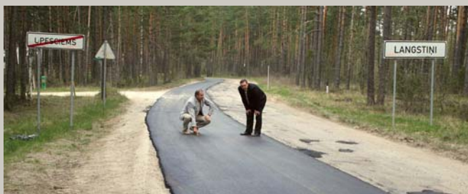
Pa celiņu, pa celiņu, Pa lielo, pa mazo: Pa lielo kungī brauce, Pa mazo darbenieki. — Elenburgas ielas asfaltēšana – 1. lpp.