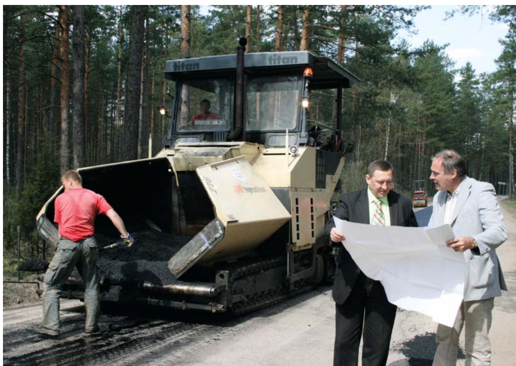
Pagasta vadība precīzē darbus