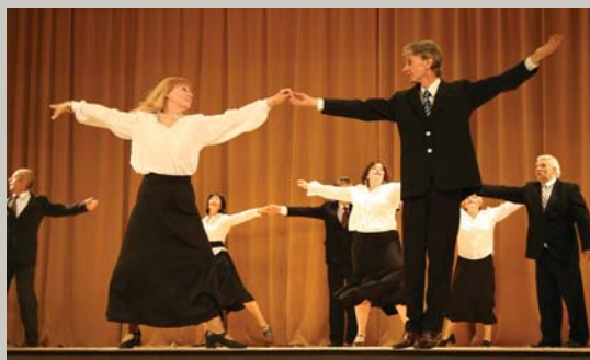
Laba tēva meita biju, Ilgi sēžu vaiņagā: Sliktam roku es nedēvu, Labs nedrīkst bildināt. — Es mācēju danci vest – 3. lpp.