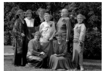
"Pīlādzīša" interesantās dāmas

Mums ir iedzīvojušies noteikts darba ritms. Sanākam vienu reizi nedēļā. Vispirms veltam nelielu laiku savam "svētdarīdam", kura laikā lasām no periodikas un