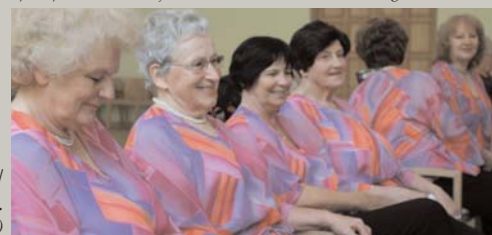
Zied ābele pret ābeli / Katrā kalna galiņā; / Dzied māsiņa pret māsiņu / Katra kunga novadā. (Dāmu ansamblis Strauts paaudžu sadarbības koncertā)

Dažādu novada pasākumu bilžu galerijas varat skatīt www.garkalne.lv foto galerijās