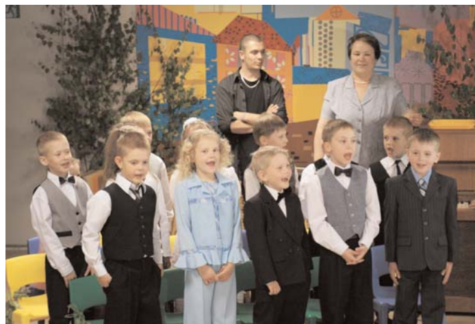
Garkalnes pirmsskolas klase