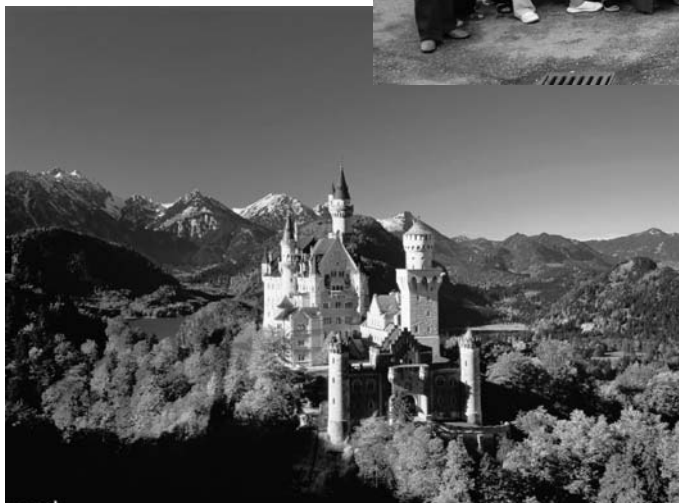
Linderhofa --- pasaku karaļa Ludviga II pils

lieliski pavadījām laiku. Devītā dienā devāmies mājup.