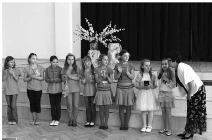
Paaudžu sadraudzības pasākuma dalībnieki