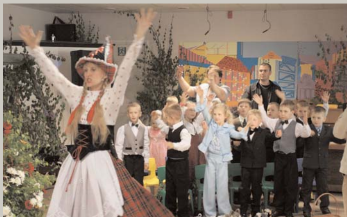
Sagriez, Dievi, miežus, rudzus / Jāņa tēva tīrumā, / Kā griežas Jāņa bērni / Jāņa tēva pagalmā. (Izlaidums Garkalnes skolas bērnu dārzā)