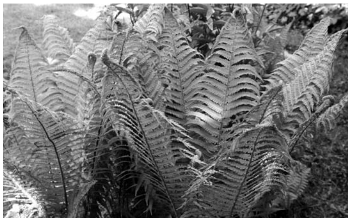
Daudz laimes mums dzimšanas dienā! Ligo!

Tas ir iemesls, kāpēc šajos svētkos gan katolis ar baptistu, gan fašists ar pacifistu, gan minoritātes ar mažoritātem spēj vienoties un būt kopā. Šampanieša vieta – alus, sveču vieta – ugunsurs, jo kurš gan spētu saskaitīt tik daudz sveču un izdzert tik daudz šampanieša? Šie ir vienotības svētki, kad dažas dienas varam nedalīt mantu un neplēst matus, bet izjust to, kāds Speks ir vienotībai. Tā allaž mums ir nesusi Atmodu.