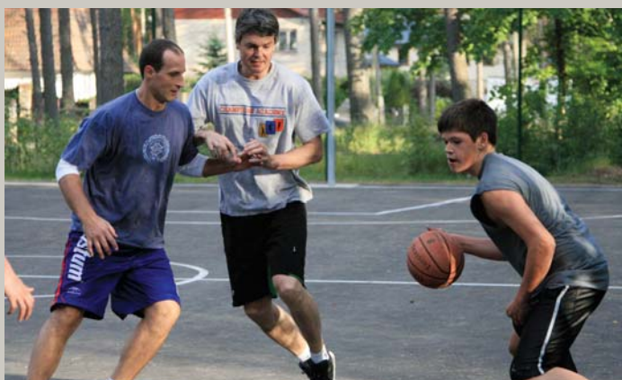
Vāverīte kuplastīte / Jaunus puīšus kaitināja: / Lec priedē, lec eglē, / Lec kuplā' i ozolā. (Basketbola laukuma atklāšana Langstīņos)