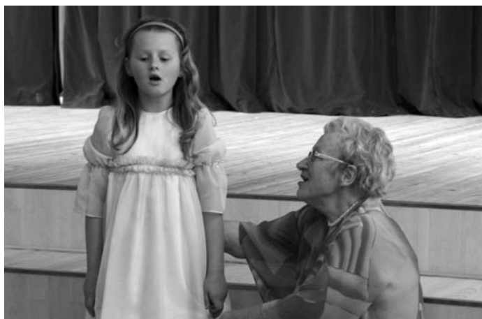
M. Poriētes kundze ar mazmeitu