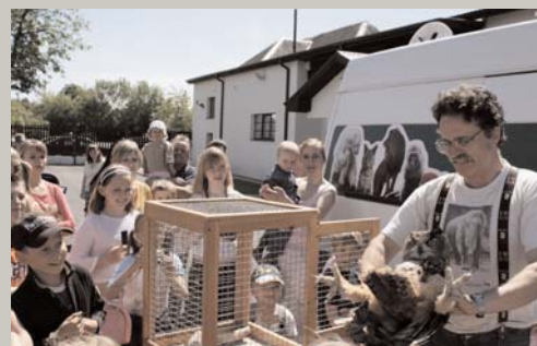
Pūce liela mediniece, / Nava svārku mugurā; / Vanagami pieci dēli, / Visiem lūša kažociņi. (Ģimeņu svētkos viesojas Doktors Dolīts ar saviem draugiem)