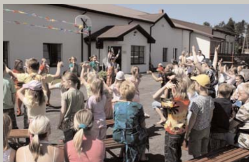
Daudz mazu pēdiņu upītes malā; / Tās mazu bērniņu notekaļatas. (Ģimeņu svētkos Garkalnes Dienas centrā)