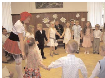
Berģu pirmsskolas izlaidums