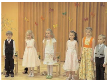
Bērnu-dārza Skudriņas izlaiduma grupa