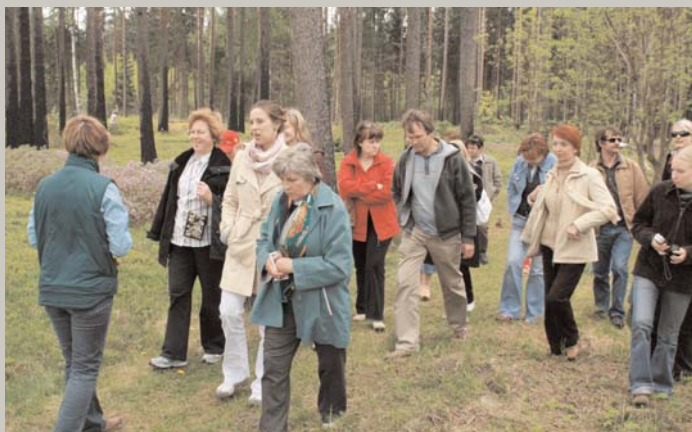
Pulkiem dzied lauku meitas, / Lauka oši neskanēja; / Dziedāj' viena meža meita, / Visi meži atskanēja. (Domes pārstāvji viesojas Kalsnavas arborētumā)