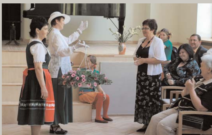
Met, māsiņ, raibus cimduš / Cūkkūtiņas dibenā, / Lai tev auga dzīvojot / Rimti raibi sīveniņi. (Pilādzītis sveic Novada Pensionāru padomi)