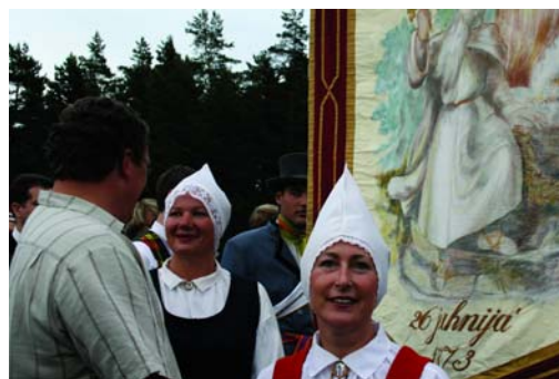
Pasaules tapšana Deju svētku lieluzvedumā "Izdejojot laiku"

dejojāja kustība, žesti un mimika. Svētku koncertuzvedumā No sirsniņas sirsniņā lieliski atklājās katra dejotāja un izdejojātā tēla kopīgais raksturs. Bet, nenoliedzami, deju svētkos nozīmīgs ir arī raksts. Deju svētku lieluzvedumā Izdejojot laiku atklājās kā dejotāji savas individuālās personības sapludina vienā varenā rakstā – simbolā – vienotā apziņā. Zemāk redzamais raksts (fragments no lieluzveduma) simbolizē pasaulu tapšanu. Dziesmu un deju svētku mākslinieciskais