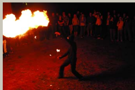
Pūt uguni, dedz uguni, / Laid man acu lūkaties, Vaj būs mana, vaj nebūs, / Tumsā vesta ligavīn'. Festivāls Bauslandē 2008, Uguns rīņis