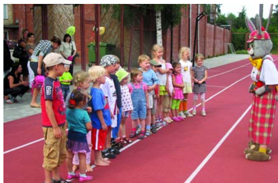
Zaķis sasveicinās ar sportistiem