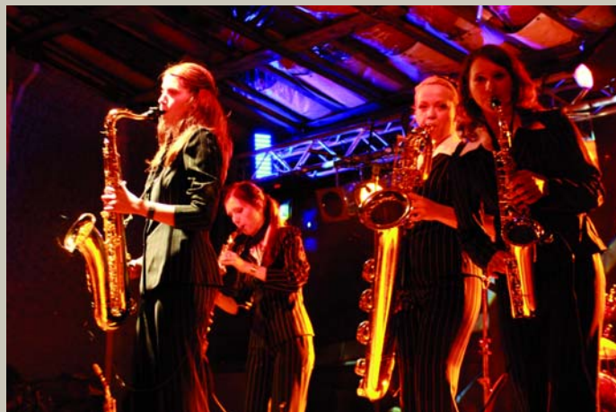
Kaimiņam četras meitas, / Duj' bij šmaules, duj' ragaiņas. Sargajiesi, bāleliņi, / Ka ragaiņas nepaņēmi. Festivāls Bauslandē 2008, Saksafona kvartets Next