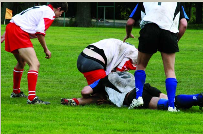
Bikšas, manas ādas bikšas, / Vēl man trejas mājās. / – Kad tev trejas mājās, Kam tev manas kājās? / Regbija Līgas kausa izcīņa starp Latvijas un Igaunijas valstsvienībām