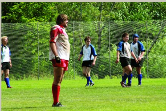
Garam gāju tam ciemam, / Rokā nesu vaiņadziņu: Liels garais tēva dēls, / Tas pēc manis lūkojās. Regbija Līgas kausa izcīņa starp Latvijas un Igaunijas valstsvienībām