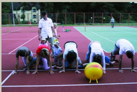
Paldies, mārša, nenicīnu, / Labs ir drēbes gabaliņš: Siki putni cauri skrēja, / Caur'i vārnas, žagatiņas. Sporta svētki ar zaķi Pēci