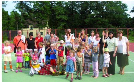
Kopbilde ar zaķi