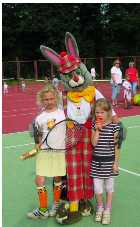
Zaķis un tenisisti!