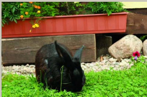
Pēters gāja zaķus šaut Uz to zaļu rudzu lauku; Nāk mājā raudadams, Zaķis purnu izbadijīs. Kroga Niki savvaļas zaķis