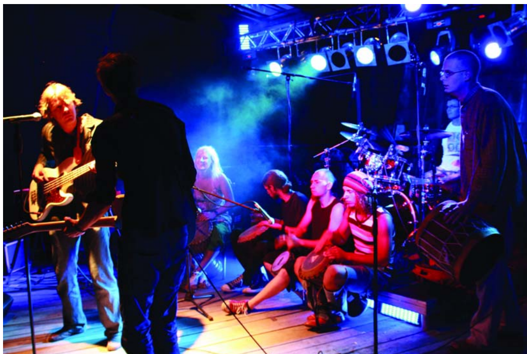
Sniega zoss apvienotais ansamblis

Cietušo un bojāgājušo nav. Visi tika cauri sveikā tikai ar vieglu izbili. GNV