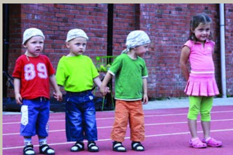
Trim pulkiem puīši jāja / Šnoretām cepurēm; Ne vienāi pulciņā / Nava mana arajiņa. Sporta svētki ar zaķi Pēci