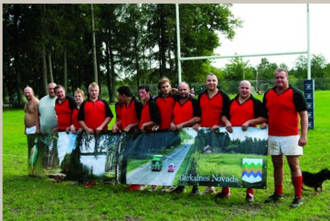
Lai ir labi, kam ir labi, Mītniekiem visiem labi: Kumeliņi, lai ir klībi, Visi tek džandžaliski. Rīgas rajona čempionāts Regbijā, Regbija klubs Garkalne