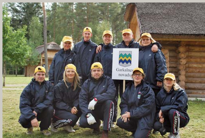
Vienaļiņa, otraļiņa, tēraudīņa, sapatīņa, Vigaļa, vagaļa, deķu, kuko, / Deīnik, desmit. Garkalnes novada domes komanda Rīgas rajona sporta spēlēs