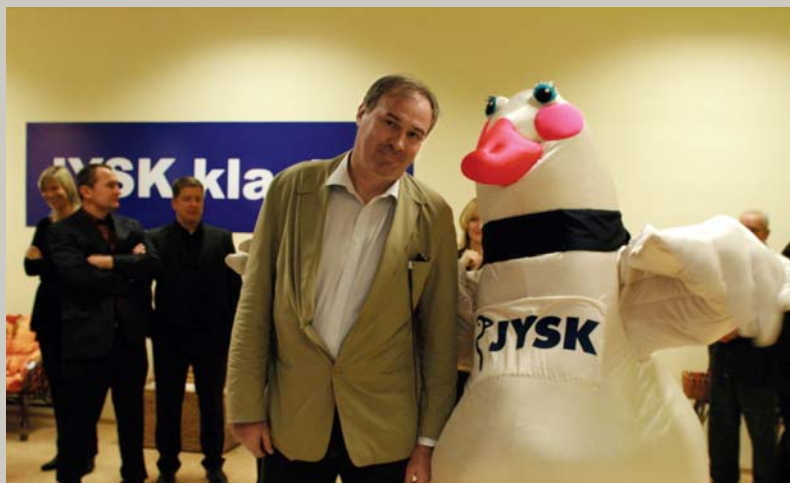
Visi putni namu dara, / Pile gula dienasvidu. Ķīze, ķīze, pīlei namu! / Strautā dzērt nedabū. JYSK loģistikas centra atklāšanas svētki