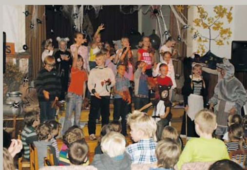
Ķipari danco Raibām biksēm, Akmiņa kurbēm, Zilām zeķēm. Berģu skolas teātris