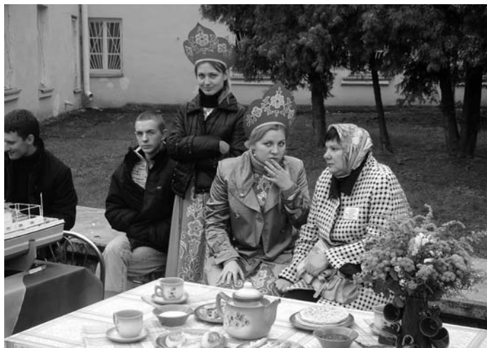
Gomeļas vietējie svētku laikā