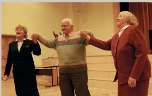
Trīs dziedāja, trīs raudāja / Treju kalnu starpiņā; Kuram labi, tas dziedāja, / Kuram slikti, tas raudāja. Starptautiskās veco ļaužu dienas svētkos