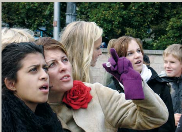
Brīnumiem es atnācu / Svešu ļaužu zemītē. Nej tie ēda, nej tie dzēra, / Uz manīm raudzījās. Ciemīni no Norvēģijas ekskursijā pa Rīgu