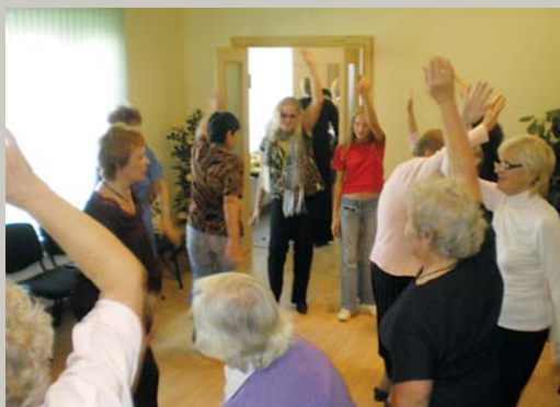
Māte lika vaķi griezt, Puiši veda dancot. Sasper vels visu raķi, Labak iešu dancot. Pensionāru balle Garkalnes dienas centrā