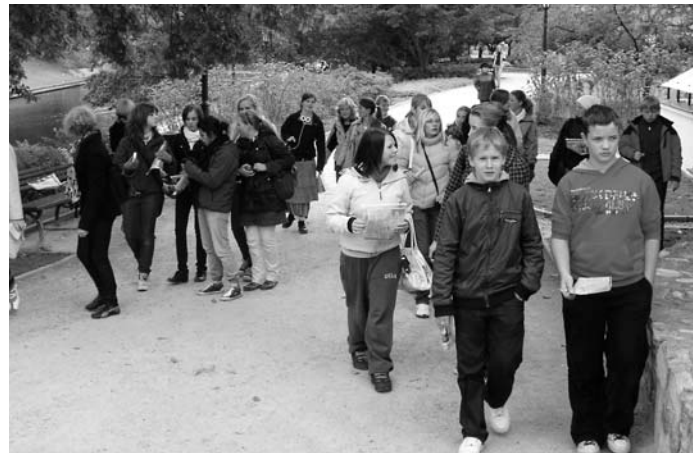
Norvēģijas un latviešu jaunieši ekskursijā pa Rīgas parkiem

Kā Jums klājas, mani mīļie, labie, skolotāji? – Cik vien ilgi kājas mīs dzimtenes baltos ceļus, cik vien cīruļi zvanīs manās debesīs, cik vien ilgi acīs raudzīs baltos bērzus un sīkos kadiķīšus, es vienmēr atminēšos Jūs, es godbijībā nolieķšu galvu Jūsu priekšā un vienmēr pie visiem svētkiem glabāšu Jūsu neaizmirstamos vārdus.