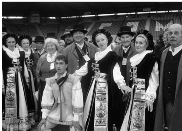
Baltābeles dejotāji kopā ar citiem festivāla dalībniekiem