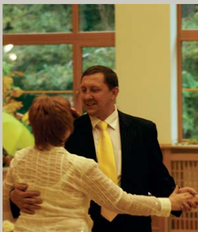
Deju, deju, lecu, lecu, Iecavniekus gaididama; Velns atspēra Granteliēti Darotiem zābakiem. Starptautiskās vecu ļaužu dienas svētkos domes priekšsēdētājs izdancina dāmas