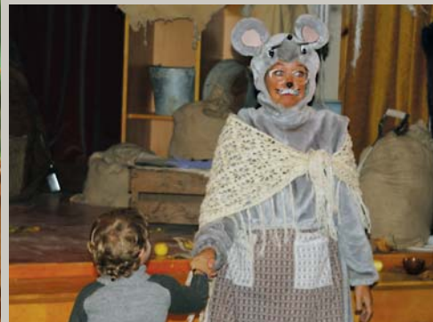
Brīnums vie', ērmis vie' / Tautu dēla klētīnā: Pele galvu nolauzusi / Tukša pūra dibīnā. Berģu skolas teātris