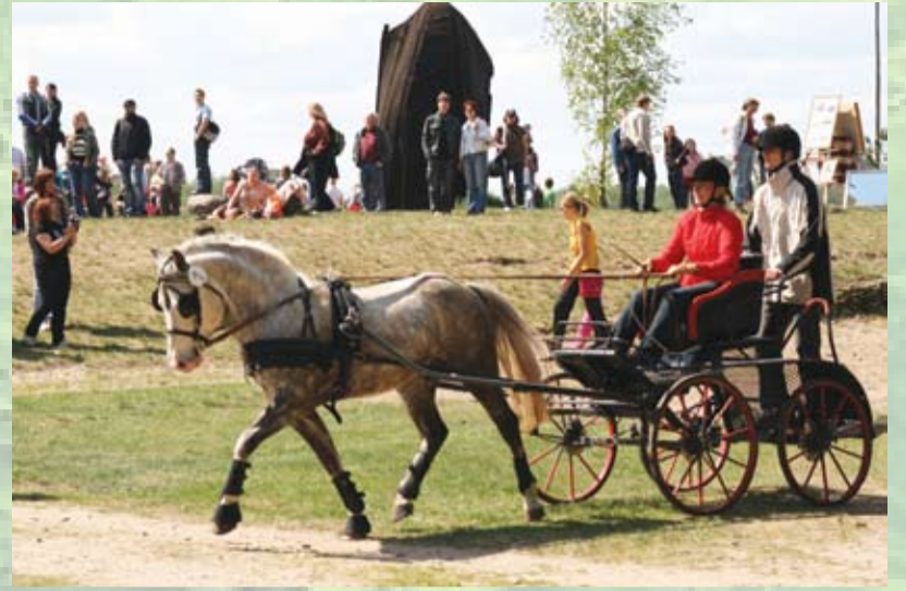
Pajūgu braukšanas sacensības Etnogrāfiskajā brīvdabas muzejā

Bērits, manis kumeliņis, Basajām kājiņām; Tas bij labi svētu rītu Pādi vest baznicā.