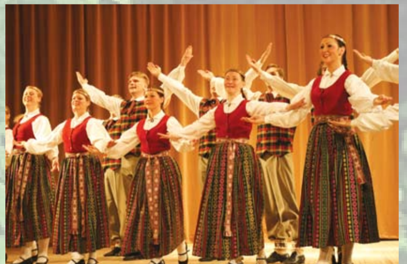
Novada deju ansambļu darba parādes koncerts

Danco Dievs ar Pērkonī, Es ar savu bāleniņu; Pērkoņam visa zeme, Man deviņi bāleniņi.