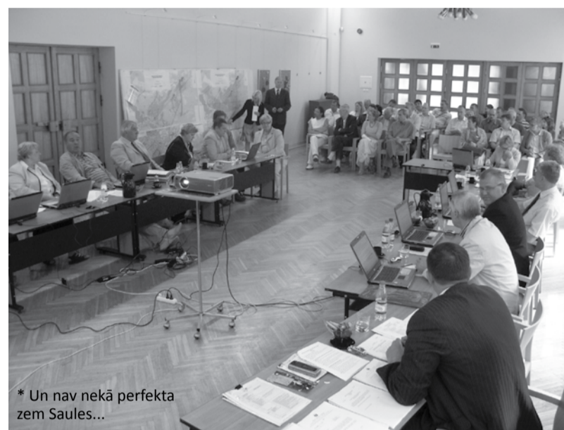
* Un nav nekā perfekta zem Saules...