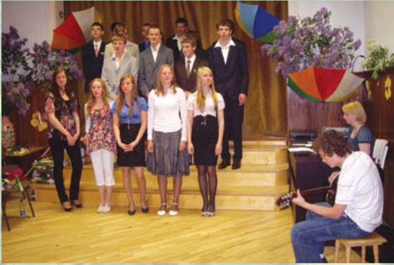
Pēdējais zvans Berģu pamatskolas 9. klasei

Kura meita ruden' dzied, Ta dzied vīra gribedama: Kura dzied pavasari, Ta dzied laiku kavedama.