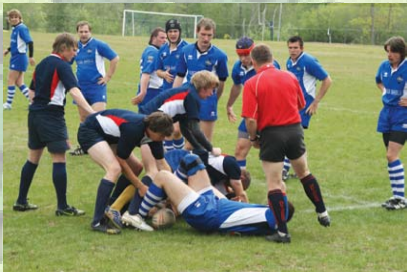
Regbija čempionāta spēle starp RK Garkalne – Livonija un RK Baldone

Smilga auga kalniņā, Zelta rasa galiņā. Tur tie jauni kara vīri Zobentiņus balināja.