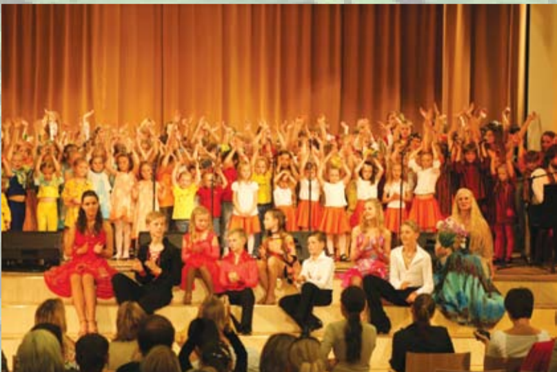
Svētki bērnu dziesmai Garkalnes Brīnumdārzs 2009

Dziedam divi, dziedam divi, Neiet šurpu, neiet turpu; Kad dziedāja liela pulka, Kā līgot nolīgoja.