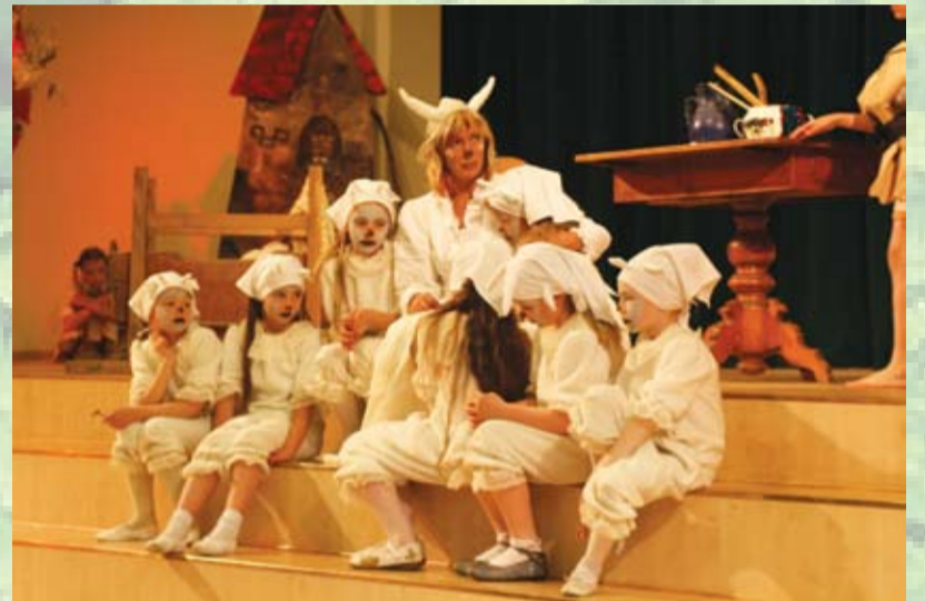
Kaza ar (tikai) sešiem kazlēniem - Pensionāru padomes jubilejā

Man bij viena balta kaza, Man bij sviesta Dievs in gan: Sviestu metu kaudzītē, Ar sieriem atstutejū.