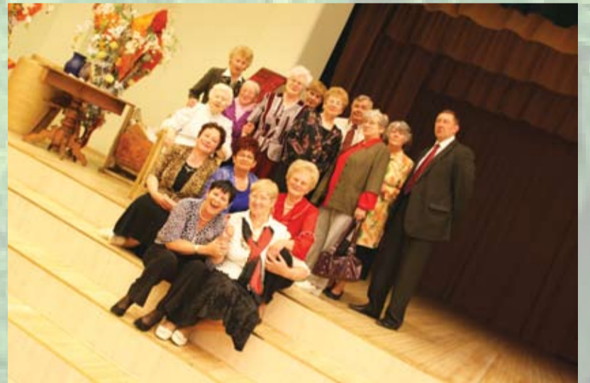
Pensionāru padomes kodols 10. jubilejā

Veci celmi, dziļas saknes, Tur aug jaunas atvasītes; Veci ļaudis, gudri vārdi, Tie māk kungus pierunāt.