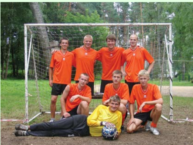
Futbola klubs "Garkalne"

Nākat ,mani bāleliņi, Nākat diži, nākat mazi, Nākat visi pulciņā, Būs man viena godešana.