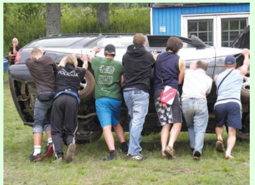
Auto sacensības "Garkalnes kauss"

Ko tu rūci, ratu rumba, Tev jau lāga neskaneja; Kad es laidu savu balsi, Purvu purvi atskaneja.