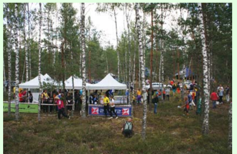
Magnēts – 37. posms

Pilli stallī sirnu zirgu, Pilli vadži iemauktiņu, Pilla tēva istabiņa Sīku mazu bāleliņu.