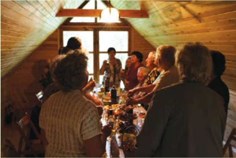
Pensionāru padomes izbraukuma sēde

Dod, Dieviņi, tādu laimi, Kā tiem mūsu vecakiem: Pilna klēts rudzu, miežu, Stallī bērī kumeliņi.