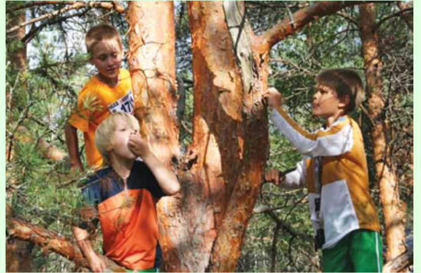
Mazie orientieristi iekaro trešo dimensiju

Kad izdzinu ganiņos, Kokā kāpu gaviļēt, Lai iet balss koka virsu, Lai dzird mani brāleliņi.