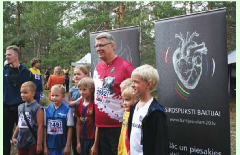
Prezidents ar jaunajiem orientēšanās dalībniekiem

Dieviņ, līdzī, debess tēvs, Man nabaga bērniņam Izbrīst dubļus, pamest laipas, No Dieviņa lab' redzēt.