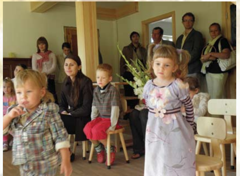
Bērnudārza "Knābis" atklāšana