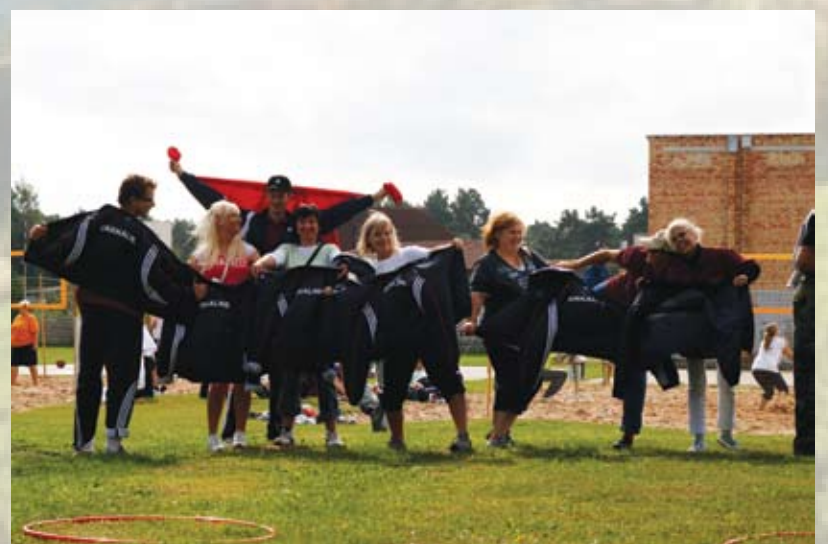
Garkalnes domes komanda Pierīgas novadu pašvaldību darbinieku sporta spēlēs