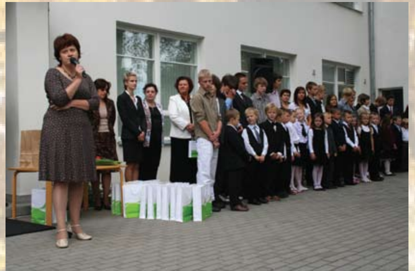
1. septembris Garkalnes-Berģu pamatskolā