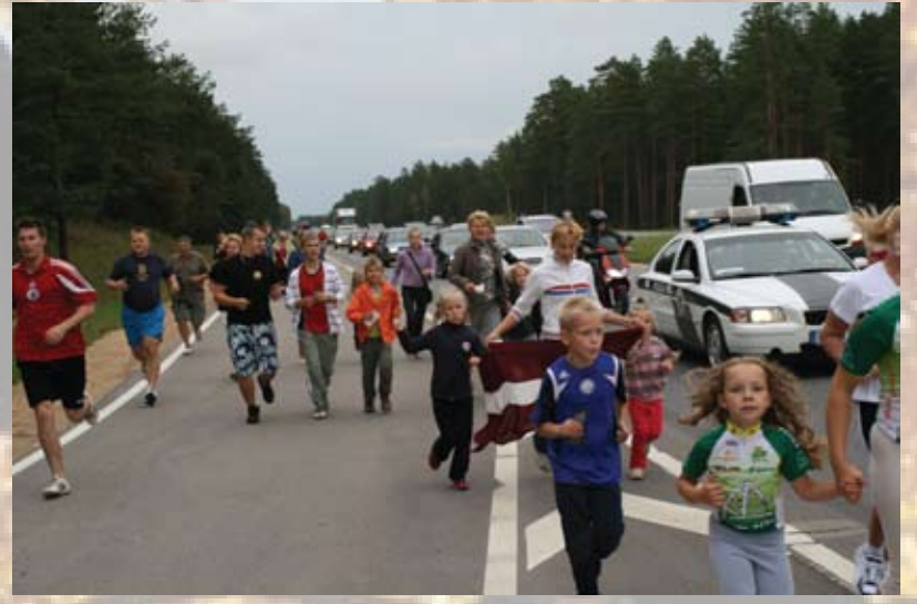
Sirdspuksti Baltijai – 369. kilometrs