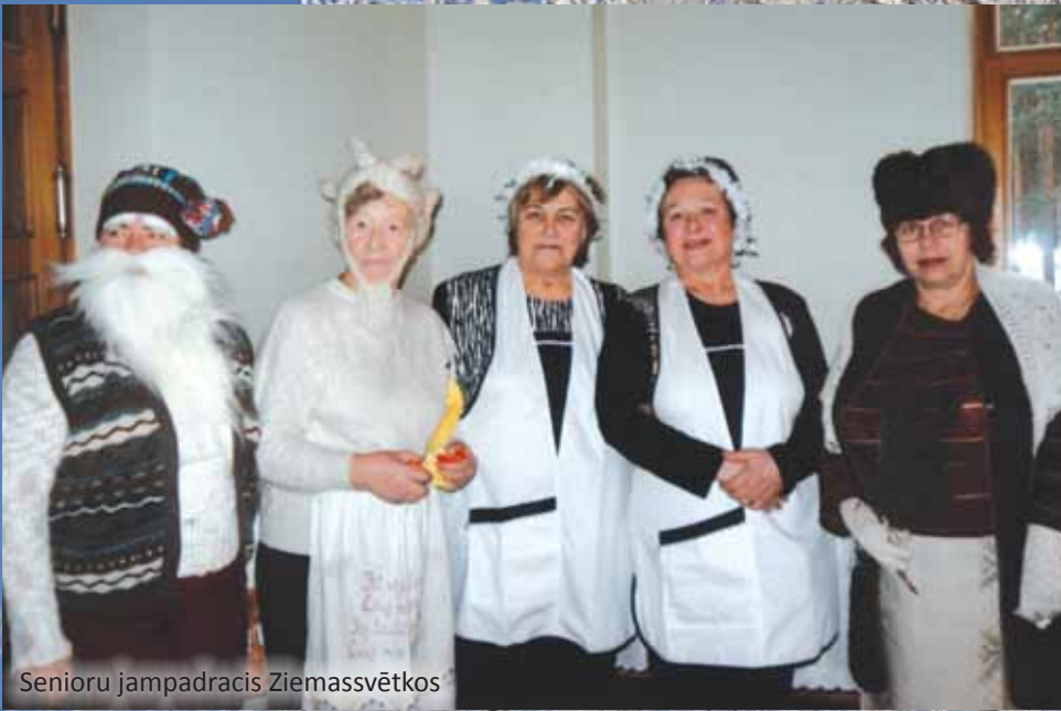
Senioru jampadracis Ziemassvētkos