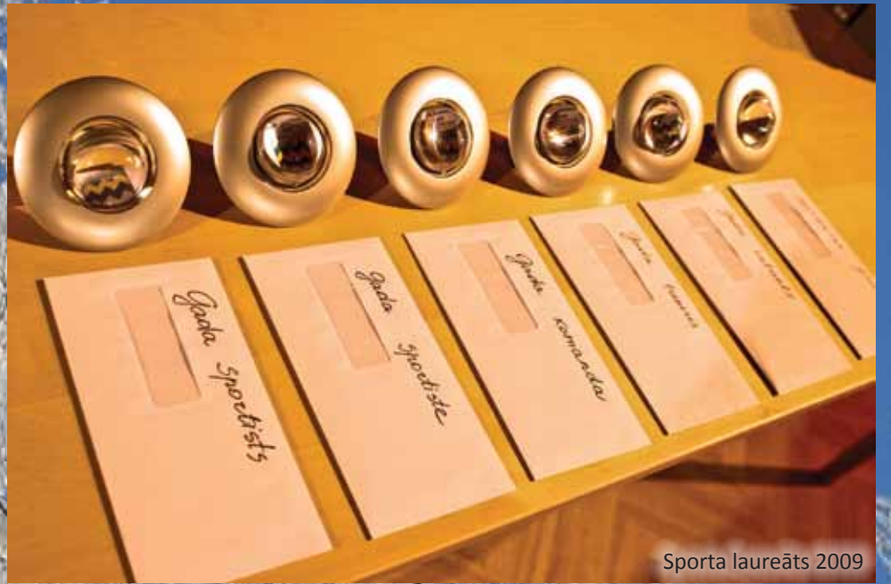
Sporta laureāts 2009