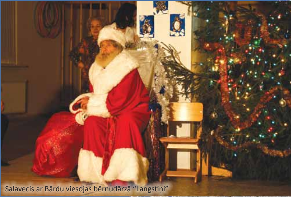
Salavecis ar Bārdu viesojas bērnu dārzā "Langstiņi"