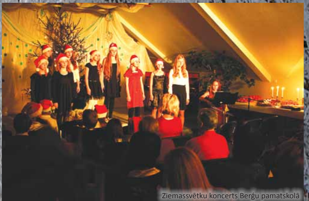
Ziemassvētku koncerts Berģu pamatskolā