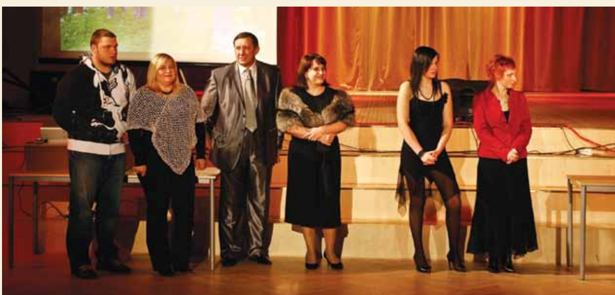
Sportiskākā ģimene: Lapsiņu ģimene (BMX, 1. vieta), Silovu ģimene (regbiji + sporta dejas, 3. vieta) un Glāzeru ģimene (jāšanas sports, 2. vieta).