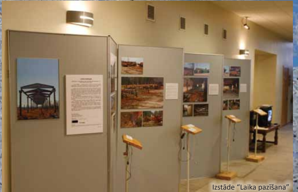
Izstāde "Laika pažišana"