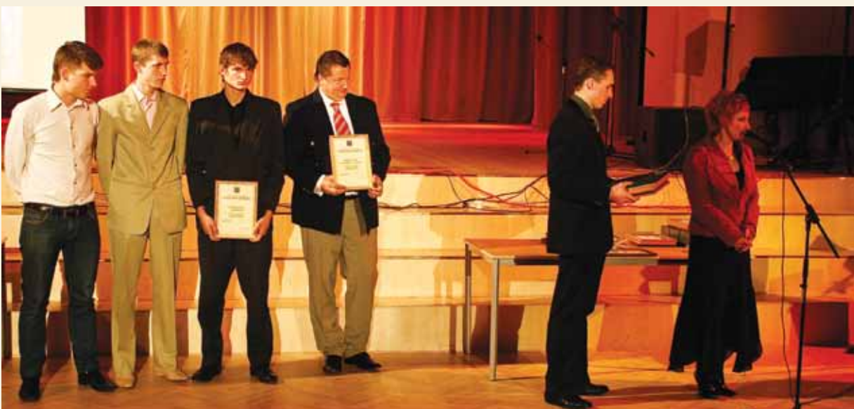
Gada komanda: FK Garkalne (futbols, 2. vieta), RK Garkalne-Livonija (regbijs, 3. vieta) un JSK Kriķi (jāšanas sports, 1. vieta).

Sportists soļo parādē, Paps un mamma aplaudē. Sportistam ir karodziņš, Papam, mammai – pīrādziņš.