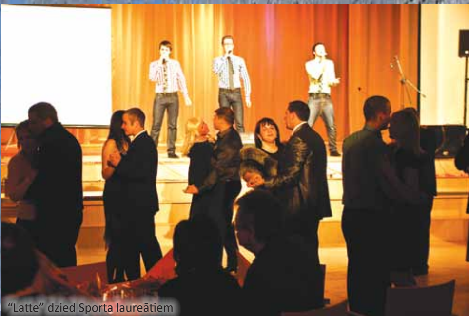
"Latte" dzied Sporta laureātiem