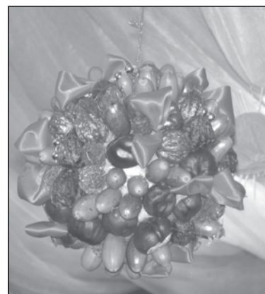
2. vieta Šokolādes bumba. Autore 2. klases skolniece Egija Riekstiņa-Dolģe