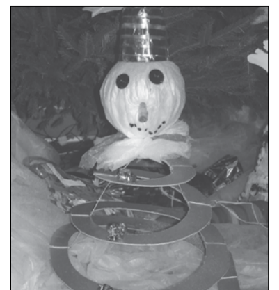
3. vieta Sniegavīrs. Autore 2. kl. skolniece Egija Riekstiņa-Dolģe