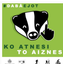
1.attēls. Pasaules Dabas fonda informatīva zīme “Ko atnesi, to aiznes”.

IECERES SKICES, GRAFISKIE UN TOPOGRĀFISKIE MATERIĀLI, KAS ATAINO TĀ NOVIETOJUMU, Telpisko APJOMU UN IEKĻAUŠANOS VIDĒ